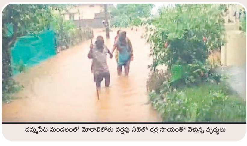
దమ్మపేట మండలంలో మోకాలిలోతు వర్షపు నీటిలో కర్ర సాయంతో వెళ్తున్న వ్యర్థులు