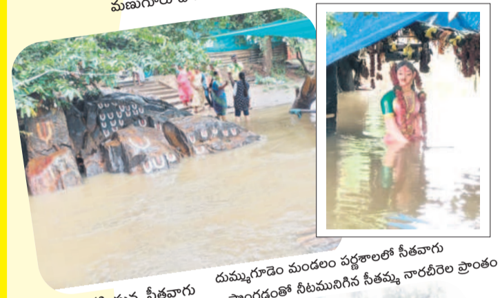
దుమ్మగూడెం మండలం పర్వతాలలో నీతవారు నిండుగా ప్రవహిస్తున్న నీతవారు పొంగడంతో నీటమునిగిన నీతమ్మ నారచీరెల ప్రాంతం