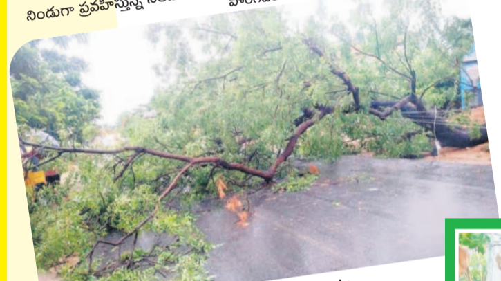
దుమ్మగూడెం: సీతారాంపురంలో రోడ్డుపై కూచిన చెట్టు