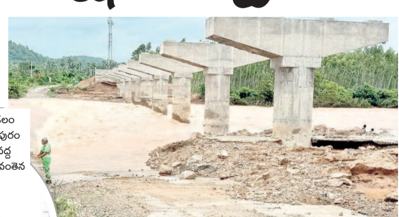
భారీ వర్షాలకు ఏడాది నీటి మునిగి యానంబైలు పాక పచ్చి (ఫైల్)

భద్రాద్రి కొత్తగూడెం, జూన్ 23 (నమస్తే తెలంగాణ): వర్షాకాలం వస్తే చాలా.. అక్కడి ప్రజలకు తిప్పలు తప్పవు. భాష్య ప్రపంచంతో సంబంధాలు ఉండవు. రాకపోకలకు అంతరాయం. లేదంటే అతికష్టమీద మరో పది కిలోమీటర్ల చుట్టూ ప్రయాణం. ఇ.డి. కిన్నె రసాని ప్రాజెక్టు దిగువన ఉన్న 20 గ్రామాల పరిస్థితి. ఈ పరిస్థితి గమనించిన గత కేసీఆర్ ప్రభుత్వం అప్పట్లోనే వంతెన నిర్మాణానికి నిధులు మంజూరు చేసింది. దశకు చేరుకున్నాయి. ఈ క్రమంలో ఎన్నికలు సమీపించడం, నియమావళి సహా ఇతరత్రా కారణాలతో పనులు ఆగిపోయాయి. అక్కడే ఆగిపోయాయి. మరలకు వరదలోనే గ్రామం నుంచి పాల్వంచ వెళ్లేటే. ఎంత కష్టమొచ్చినా భారీగా భారీగా భారీగా వరద తగ్గాకే వెళ్లాలి ఉంటుంది. మంచి నాయకులు ఉంటే గ్రామాల అభివృద్ధి చెందుతాయి. మాకు శనిరా ఉండే నాయకులు వస్తే ఇలానే ఉంటుంది. ఇన్ని రోజులుగా బ్రిడ్జిని కడుతూనే ఉన్నాం. పొలకులుగానీ, అధికారులుగానీ మా ఊరికి వస్తే తెలుస్తుంది మా కష్టాలేమిటో.