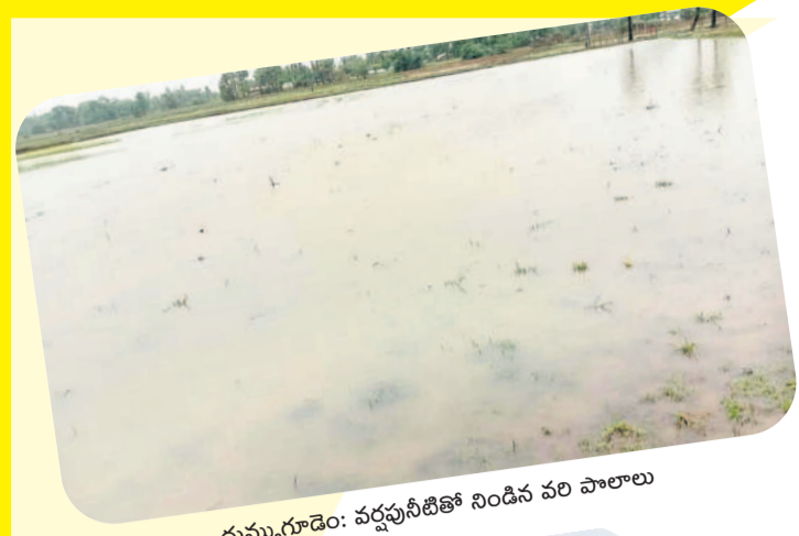
దుమ్మగూడెం: వర్షపునీటితో నిండిన వరి పొలాలు