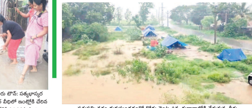
సత్తుపల్లి: వర్షం కురుస్తుండడంతో రోడ్డు వెంట ఉన్న గుడారాల్లోకి చేరుతున్న నీరు