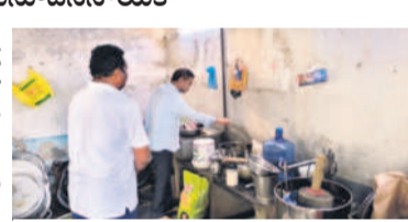
హాస్టల్ కిచ్చిన తనిఖీ చేస్తున్న అదనపు కలెక్టర్