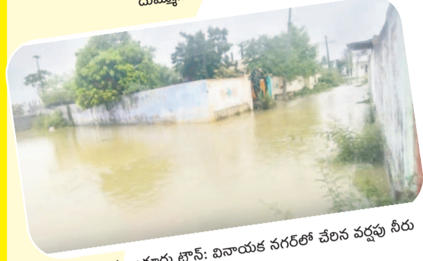
మణుగూరు టౌన్: వినాయక నగర్లో చేరిన వర్షపు నీరు