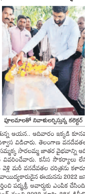
పూలమాలతో నివాళులర్పిస్తున్న కలెక్టర్