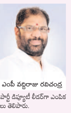
ఎంపీ వద్దిరాజు రవిచంద్ర

ఖమ్మం/ రఘునాథపాలెం, జూన్ 23: రాజ్యసభ సభ్యుడు వద్దిరాజు రవిచంద్రను బీఆర్ఎస్ పార్లమెంటరీ పార్టీ డిప్యూటీ లీడర్గా పార్టీ అధినేత కల్వకుంట్ల చంద్ర శేఖరరావు (కేసీఆర్) ఆదివారం నియమించారు. పార్టీ అధ్యక్షుడు కేసీఆర్ ఆశీర్వాదంతో ఆయన ఇటీవలే మరో సారి రాజ్యసభకు ఏకగ్రీవంగా ఎన్నికైన విషయం విదితమే. బీసీ వర్గానికి చెందిన రవిచంద్రను.. బీఆర్ఎస్ పార్లమెంటరీ పార్టీ ఉపనేతగా నియమించడం పట్ల ఖమ్మం జిల్లా బీఆర్ఎస్ నాయకులు, కార్యకర్తలు, అభిమానులు, బీసీ నాయకులు, అన్ని వర్గాల ప్రజలు హర్షం వ్యక్తం చేస్తున్నారు. కాగా, తనను బీఆర్ఎస్ పార్లమెంటరీ పార్టీ డిప్యూటీ లీడర్గా ఎంపిక చేసిన పార్టీ అధినేత కేసీఆర్ రవిచంద్ర ప్రత్యేక కృతజ్ఞతలు తెలిపారు.