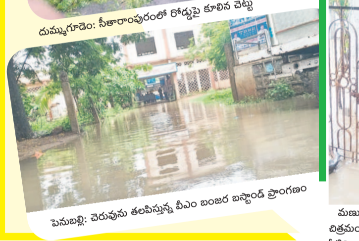
పెనుబల్లి: చెరువును తలపిస్తున్న వీఎం బంజర బస్టాండ్ ప్రాంగణం