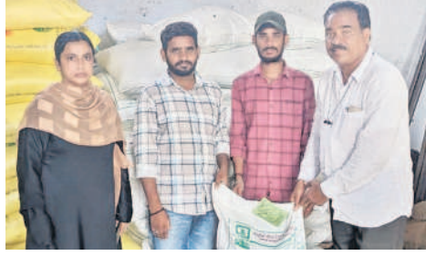
కోటగిరిలో విత్తనాలు అందజేస్తున్న ఏవో(ఫైల్)