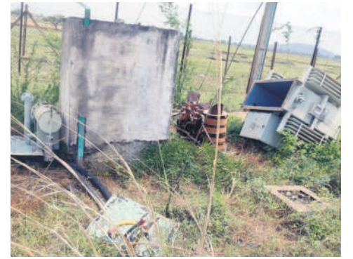
దుండగులు ధ్వంసం చేసిన ట్రాన్స్ ఫార్మర్