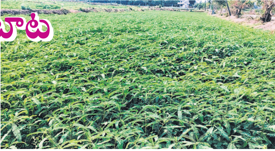
కొత్తపల్లి శివారులో ఏపూగా పెరిగిన పచ్చిరొట్ట

చౌడు భూములలో పాలు పరి పండించే భూముల్లో ఎకరాకు 20 కిలోల జీలుగ పచ్చిరొట్ట విత్తనాలను పాలమంతా చల్లాలి. జీలుగను పూత దశలో కలియదున్నడంతో ఎకరాకు 6-8 టన్నుల పచ్చిరొట్ట లభిస్తుంది. ఎకరం పచ్చిరొట్టలో 30-32 కిలోల నత్రజని లభిస్తుంది. జీలుగలో 3.5 శాతం నత్రజని, 0.6 శాతం భాస్వరం, 1.2 శాతం పొటాష్ లభిస్తుంది. నీరు నిలిచినా పంట తట్టుకుంటుంది.