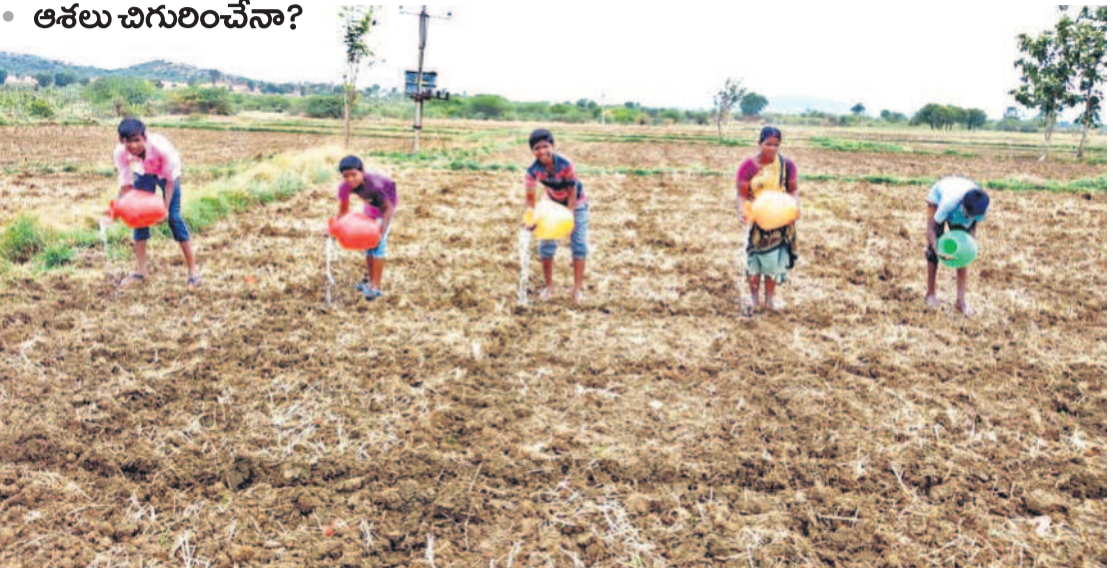
నారాయణపేట జిల్లా మరలకల్ మండలం ఎలిగండ్లలో పత్రి మంటకు బిందెలతో నీటిని పోస్తున్న రైతులు. వానలు ముందే మురిపించడంతో విత్తనాలు వేసిన రైతులు ఆ తర్వాత వరుణుడు ముఖం చాటిందంతో ఇలా బిందెలతో విత్తనాలను తడుపుతూ కాపాడుకునే ప్రయత్నం చేస్తున్నారు.

రాష్ట్ర ఇన్-చార్జ్ కలిసి నామినేటివ్ జాబితా రూపొందించాలని ఆదేశాలు. పార్లమెంట్ ఎన్నికల కోడి ముగిసి 3 వారాలైనా వెలువడని ఉత్తర్వులు.