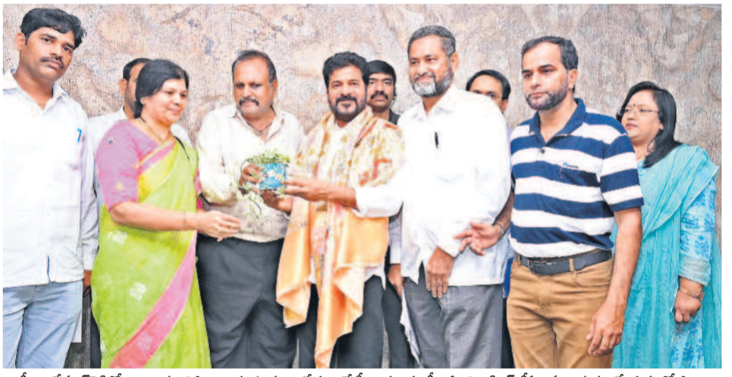
సీఎం రేవంత్ రెడ్డితో అదివారం ఉపాధ్యక్షుల సంఘాల నేతలు భేటీ అయ్యారు. వీ ఆర్, పెండింగ్ డీఎలను విడుదల చేయడంతో పాటు సమస్యలను పరిష్కరించాలని విజ్ఞప్తి చేశారు. వదోస్తామని కల్పించడంపై సీఎం రేవంత్ వాటా తెలియజేశారు.