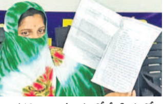
పెద్దపల్లి జిల్లా మండలిలో మీడియాతో మాట్లాడుతున్న బాలిత మహిళ