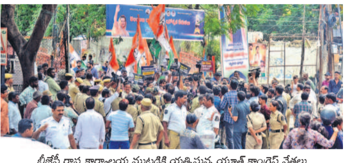
బీజేపీ రాష్ట్ర కార్యాలయ ముట్టడికి యత్నిస్తున్న యూత్ కాంగ్రెస్ నేతలు