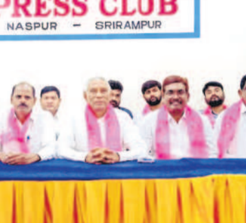
ప్రెవెంటివ్ కమిటీకి అసెంబ్లీలో తీర్మానం చేయండి

బొగ్గు గనులను సింగరేణి సంస్థకే అప్పగించాలి