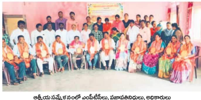
ఆత్మీయ సమ్మేళనంలో ఎంపీటీసీలు, ప్రజాప్రతినిధులు, అధికారులు