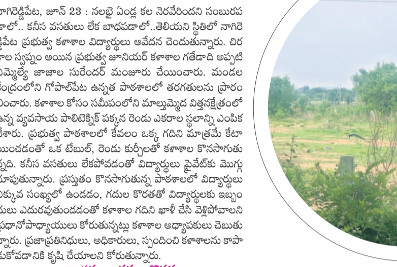
స్థలం లేక రోడ్డుపై కట్టిన కళాశాల ఫైటీ

నాగిరెడ్డిపేట, జూన్ 23 : నలభై ఏండ్ల కాల నెరవేరిందని సంబర భువించాల్సి ఉంది. కనీస వసతులు లేక బాధపడాలి.. తెలియని స్థితిలో నాగిరె డ్డిపేట ప్రభుత్వ కళాశాల విద్యార్థులు ఆవేదన చెందుతున్నారు. విర కాల స్వస్థలం అయిన ప్రభుత్వ జూనియర్ కళాశాల గతేడాది అప్పటి ఎమ్మెల్యే జాషా అసేందర్ మంజూరు చేయించారు. మండల కేంద్రంలోని గోపాలపేట ఉన్నత పాఠశాలలో తరగతులను ప్రారం భించారు. కళాశాల కోసం సమీపంలోని మాల్కొండ విత్తవక్షేత్రంలో ఉన్న వ్యవసాయ పారిశుధీకరణ పనులు ఎక్కడో స్థలాన్ని ఎంపిక చేశారు. ప్రభుత్వ పాఠశాలలో కేవలం ఒక్క గదిని మాత్రమే కేటా యించడంతో ఒక టేబుల్, రెండు కుర్చీలతో కళాశాల కొనసాగుతు న్నది. కనీస వసతులు లేకపోవడంతో విద్యార్థులు పైవేటికే మొగ్గు చూపుతున్నారు. ప్రస్తుతం కొనసాగుతున్న పాఠశాలలో విద్యార్థులు ఎక్కువ సంఖ్యలో ఉండడం, గదుల కొరతతో విద్యార్థులకు ఇబ్బం దులు ఎదురవుతుండడంతో కళాశాల గదిని ఖాళీ చేసి వెళ్లివేవాలని ప్రధానాధికారి అధికారులు కోరుతున్నట్లు కళాశాల అధికారులు చెబుతు న్నారు. ప్రజాప్రతినిధులు, అధికారులు, స్పందించి కళాశాలను కాపా డకోవడానికి కృషి చేయాలని కోరుతున్నారు.