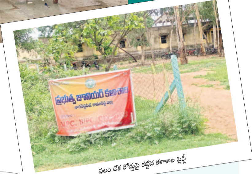
ప్రవారం లేదు..విద్యార్థులు రాదు