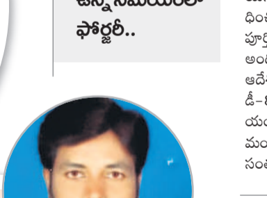
విద్యార్థులు కళాశాలలో ఐదు రోజుల క్రితం జరిగిన మాడు రోజుల క్రితం సంబంధిత ఏకాతో యనగా పరిగణించారు. అందుకు సంబం ధించిన బాధ్యులు ఎవరనే విషయంలో పూర్తిస్థాయి దర్యాప్తు చేపట్టి నివేదికను నివేదికను సమీక్షించాలని కిందిస్తామని అధికారులను ఆదేశించారు. నిజామాబాద్ విద్యుత్ శాఖ డీ-8 సెక్షన్ ఏకా సెలవులో ఉన్న సమ యంలో ఓ సంస్థకు మీటర్ జారీ చేస్తూ మంజూరు చేసిన ఆర్డర్ కాపీలో ఉన్నది తన సంవత్సరం కాదని, ఫోర్జర్ జరిగినట్లు ఏకా