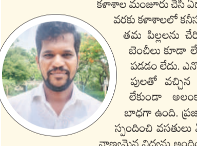
కళాశాల మంజూరు చేసి ఏడాది అవుతున్నా ఇప్పటి వరకు కళాశాలలో కనీస వసతులు, గదులు లేవు.