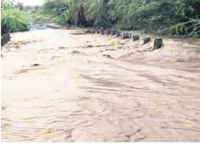
అదివారం మునిపల్లి మండలంలో పొంగిపొర్లుతున్న బొదవల్లి-అన్న చెల్లడ వారు

మునిపల్లి, జూన్ 23 : సంగారెడ్డి జిల్లా మునిపల్లి మండలంలో అదివారం భారీ వర్షం కురిసింది. వారం నుంచి పలువురు లేక రైతులు దిగాలు చెందుతున్న క్రమంలో భారీ వర్షం కురిస్తే రైతులకు సుఖం కలుగుతుంది. ఇక ఎవ్వరైనా పనులు సాగుతాయని సంతోషం వ్యక్తం చేస్తున్నారు. భారీ వర్షంతో మండలంలోని పలు గ్రామాల్లో చెరువులు, కుంటలకు నీళ్లు చేరాయి. బొదవల్లి-చిన్నచెల్లడ గ్రామాల మద్య వారు పొంగి పొర్లుతూ కొంతసేపు రాకపోకలు నిలిచిపోయాయి.