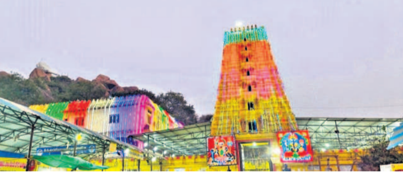
కొమురవెల్లి మల్లన్న ఆలయం