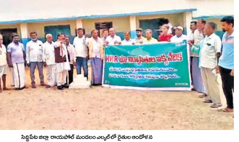
సిద్దిపేట జిల్లా రాయపేట్ మండలం ఎల్.ఎల్. రైతుల ఆందోకన