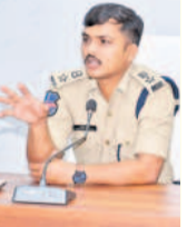
-చెన్నై రూపేష్, ఎస్. సంగారెడ్డి జిల్లా

డ్రగ్స్ రహిత జిల్లాగా మార్చడానికి టీజీ న్యూబీ, పోలీసు శాఖ అధ్యక్షులతో తీవ్రంగా భేషిచేస్తున్నారు. నిషేధిత మత్తు పదార్థాల తయారీ, వాడకం రెండూ నేరమే. డ్రగ్స్ తయారు చేసిన వారిపై, వాడిన వారిపై తరచు చర్యలు తీసుకుంటాం. గుట్టుపచ్చుడు కాకుండా ఏక్కడైనా నిషేధిత మత్తు పదార్థాలు తయారుచేస్తుంటే పోలీసులకు సమాచారం ఇస్తే దాడులు చేసి చర్యలు తీసుకుంటాం. సమాచారం ఇచ్చిన వారిపై గోప్యంగా ఉంచుతాం. ప్రజలు ముఖ్యంగా యువత డ్రగ్స్ దూరంగా ఉండాలి. జిల్లాలో నిఘా పెట్టి డ్రగ్స్ నిర్మూలకు చర్యలు తీసుకుంటాం.