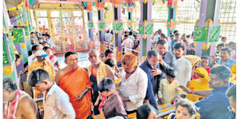
మెదక్ జిల్లా ఏడుపాయల ఆలయంలో ఎదుట భక్తుల సందడి