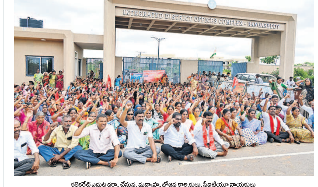
కలెక్టరేట్ ఎదుట ధర్నా చేస్తున్న మధ్యాహ్నం భోజన కార్మికులు, సీఐటీయూ నాయకులు

కచ్చితమైన ఫలితం తెలిసేలా.. రైతులు తమ భూమిలోని సారాన్ని తెలుసుకుని అందుకు తగ్గట్టుగా పంటలను సాగు చేసేందుకు భూసార పరీక్షలు దోహదపడనున్నాయి. సమాజం మే నెలలోనే మట్టి సమూహాలను సేకరిస్తారు. ఈసారి కొంత ఆలస్యం కావడంతో ప్రస్తుత వానకాలం సీజన్లో అనుకున్న లక్ష్యం మేరకు సమూహాలను సేకరించనున్నారు. గతంలో ప్రతి 25 ఎకరాలకు ఒకటి చొప్పున మట్టి సమూహాలను సేకరించేవారు. అయితే ఈసారి కేవలం రెండున్నర ఎకరాలకు ఒకటి చొప్పున శాంపిల్స్ తీయనున్నారు. దీంతో పంట క్షేత్రాల సంఖ్య తగ్గి ఎక్కువ సమూహాలను సేకరిస్తుండడంతో ప్రతి అంగుళంలో ఉన్న మట్టి గురించి తెలుసుకునే అవకాశం కలుగునున్నది. ఫలితంగా కచ్చితమైన భూసార పరీక్షలు తెలుస్తాయి. ఈ ఫలితాల ఆధారంగా ఏ ఏ ఏ పంటలను సాగు చేయాలి! తెలుసుకునే వీలు రైతులకు కలుగుతుంది. తద్వారా