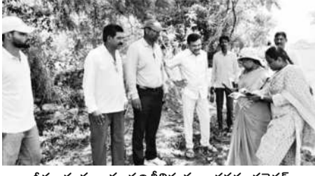
బీడు భూములను పరిశీలిస్తున్న అదనపు కలెక్టర్

కూసుమంచి, జూన్ 25: మండలంలోని గుర్జాయగుడెం సమీపంలో బిడు భూములను పరిశీలించి... పరిశీలించారు.