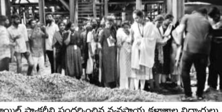
పామా యిల్ ఫ్యాక్టరీని సందర్శించిన వ్యవసాయ కళాశాల విద్యార్థులు