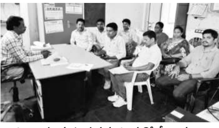
పాల్యం: మాట్లాడుతున్న ఎంపిక వోలీర్లు

పాల్యం, జూన్ 25: రాష్ట్ర ప్రభుత్వ ఆదేశాల మేరకు హైదరాబాద్ లోని హాకింపేట తెలంగాణ క్రీడా పాఠశాలలో 4వ తరగతిలో ప్రవేశానికి ఎంపిక పోటీలను ఈ నెల 27వ తేదీన నిర్వహిస్తున్నట్లు ఆయా మండలాల ఎంపిక వోలు తెలిపారు.