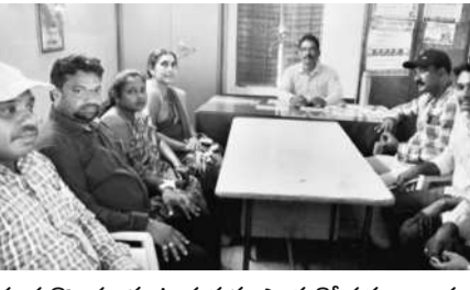
చంద్రగిరి: మాట్లాడుతున్న ఎంపిక వోలీర్లు