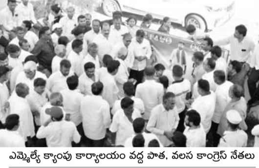
ఎమ్మెల్యే క్యాంపు కార్యాలయం వద్ద పాత, వలస కాంగ్రెస్ నేతలు

అధికార పార్టీలో భగ్గుమన్న విభేదాలు సూక్ష్మతంగా మందలించిన ఎమ్మెల్యే జార్