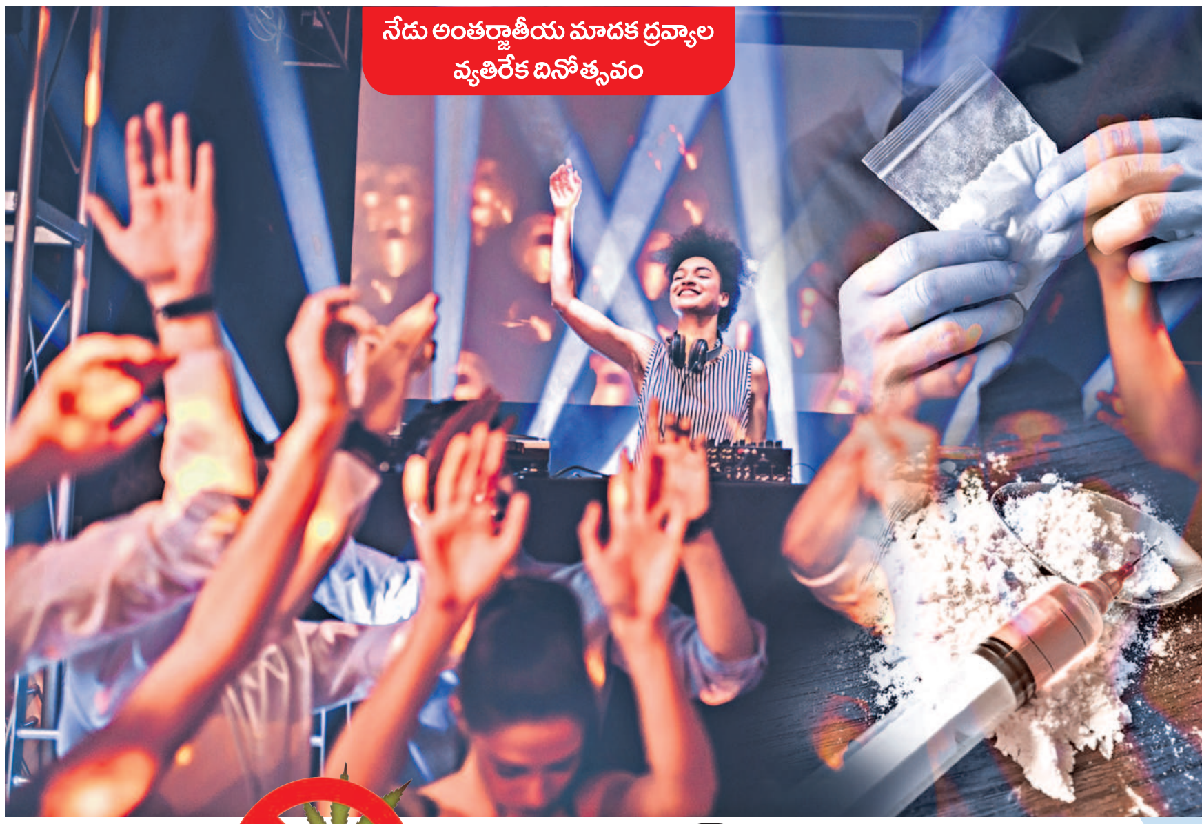
నేడు అంతర్జాతీయ మాదక ద్రవ్యాల వ్యతిరేక దినోత్సవం

రేవ్ పార్టీలో ఏమంటుంది.. మహా అయితే తాగుతారు. సరదాగా డ్యాన్స్ చేస్తారు. అంతేగా అనుకుంటారు చాలా మంది! అరిష్టద్యాలను ఆధీనంలో ఉంచుకున్న కలి కూడా ఈ పార్టీని చూస్తే.. ఆశ్చర్యపోతారు. అంత పచ్చగా ఉంటుంది పార్టీలో వాతావరణం. ఇక్కడ ఇరిగ్ తంతు సామాన్యుల ఊహకు అందదు. సూర్యాస్తమయంతో మొదలయ్యే విశ్రాంతి విన్యాసం మర్నాడు సూర్యోదయం వరకు విచ్చలవిచ్చిగా కొనసాగుతూనే ఉంటుంది. ఇలాంటి పార్టీలకు వ్యక్తుల ఎంపిక సువిచి వారు స్వస్థలానికి క్షేమంగా వెళ్లే వరకూ అంతా గోప్యంగా సాగుతుంది. అలాగని ఎవరు పడితే వారు ఈ జోన్లోకి అడుగుపెట్టలేరు. పార్టీకి ఎవరు రావాలనేది నిర్మాణాత్మక డిస్కం చేస్తారు. సెలెబ్రిటీలు, సంపన్నులు, వ్యాపారవేత్తల వారసులు ఇలా ఉన్నప్పుడు వారిని డ్రగ్ పెడ్లర్స్ ఆహ్వానిస్తారు.