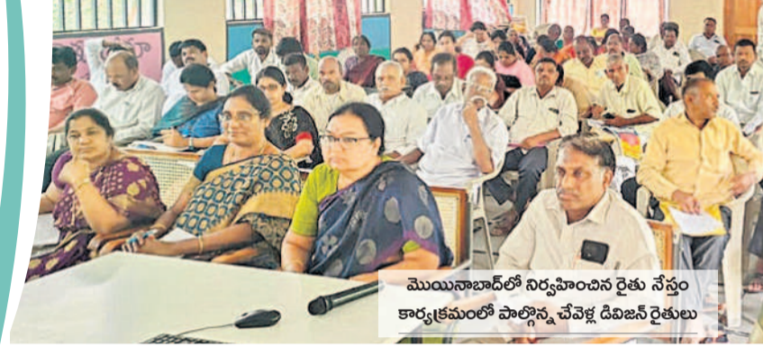
మొయినాబాద్లో నిర్వహించిన రైతు నేతల కార్యక్రమంలో పాల్గొన్న చేపవే వెన్నె రైతులు

రంగారెడ్డి, జూన్ 25 (నమస్తే తెలంగాణ) : పంట పెట్టుబడి సాయం రూపు మారుతున్నది. సాగు చేస్తున్న భూములకే 'రైతు భరోసా' కింద ఆర్థిక సాయం అందించాలని కాంగ్రెస్ ప్రభుత్వం సూత్రప్రాయంగా అంగీకరించింది. పలు కోరికతో సాయాన్ని తగ్గించి అర్హి భూములను తగ్గించుకునే ప్రయత్నం చేస్తున్నది. రైతులను అధిగ్రహించే ప్రయత్నం చేస్తున్నది. రైతుల నుంచి వ్యతిరేకత వస్తే ఎలా? అని ముందే గ్రహించిన ప్రభుత్వం రైతుల మనస్సులో ఉన్నదేమిటో తెలుసుకునేందుకు అభిప్రాయ సేకరణను చేపట్టాలని నిర్ణయించింది. ఈ మేరకు రంగారెడ్డి జిల్లాలో మంగళవారం ఐదు రైతు వేదికలో వ్యవసాయ శాఖ అభిప్రాయ సేకరణను చేపట్టింది. నియోజకవర్గానికి ఒకటి కొవ్వూ.. ఇబ్రహీంపట్లలో నియోజకవర్గానికి మంచాల రైతు వేదిక, మహేశ్వరంలో నియోజకవర్గానికి కందుకూరు, రాజేంద్రగఠ్ నియోజకవర్గానికి నందిగామ, చాపెర్లలో నియోజకవర్గానికి మల్లారం, చేపవే నియోజకవర్గానికి మొయినాబాద్లోని రైతు వేదికలో అభిప్రాయ సేకరణను నిర్వహించారు. ఈ కార్యక్రమానికి రైతులు అంతరంగ మాత్రంగా హాజరయ్యారు. ఐదు రైతు వేదికలకు కేవలం 356 మంది మాత్రమే హాజరయ్యారు. అభిప్రాయ సేకరణ సైతం తూతూమంత్రంగానే సాగింది. రైతు వేదికకు