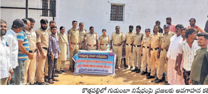
కొత్తపల్లిలో గుడుంబా నిషేధంపై ప్రజలకు అవగాహన కల్పిస్తున్న ఎక్సైజ్ శాఖ అధికారులు, పాల్గొన్న గ్రామస్థులు