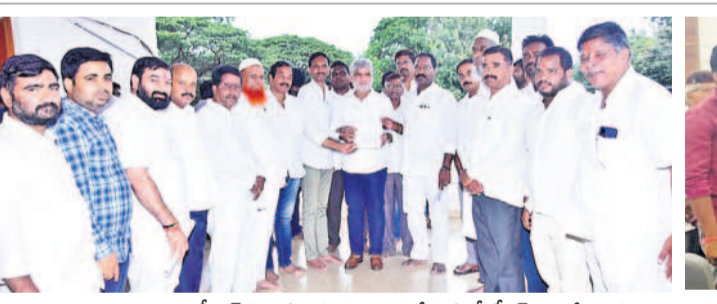
స్వీకరణ వినతి పత్రం అందజేస్తున్న బీటీఎస్ కాలనీ వాసులు , పార్కు స్థలాన్ని కాపాడాలని కలెక్టర్ కు ఫిర్యాదు చేస్తున్న కాలనీ వాసులు

లపై చట్టాన్ని చర్యలు తీసుకుంటామన్నారు. బెల్లం సరఫరా చేసేవారిపై కేసులు నమోదు చేస్తున్నామన్నారు. లక్ష రూపాయలు జరిమానా విధించడంతో పాటు అదే పాఠ పాట్లు చేస్తే పీడి యాక్ట్ కేసులు నమోదు చేస్తామని తెలిపారు. దీనికి గాను ప్రజలకు అవగాహన కల్పిస్తున్నామని తెలిపారు. ఈ కార్యక్రమంలో ఎక్సైజ్ శాఖ సిబ్బంది, గ్రామాల ప్రజలు పాల్గొన్నారు.