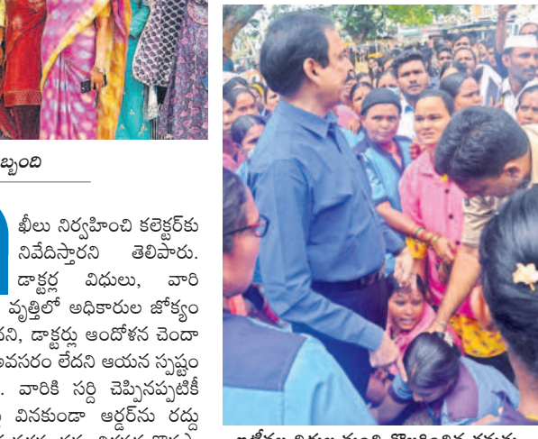
ఇటీవల విద్యుల నుంచి తొలగించిన తమను తిరిగి తీసుకోవాలని ప్రాధేయపడుతున్న శానిటేషన్ సిబ్బంది