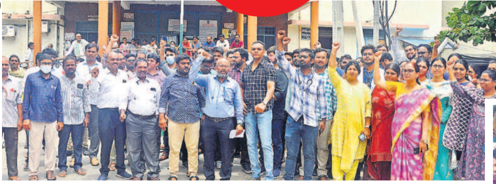
నల్గొండ జనరల్ దవాఖాన ఎదుట నిరసన తెలుపుతున్న డాక్టర్లు, ఆరోగ్య సిబ్బంది

నీలగిరి, జూన్ 27 : మొదలైన వైద్య సేవల కోసం పర్యవేక్షణ పేరుతో ఇతర శాఖల అధికారులు తమపై పెత్తనం చేస్తున్నారని నల్గొండ ప్రభుత్వ జనరల్ ఆస్పత్రిలోని ప్రొఫెసర్లు, అసిస్టెంట్ ప్రొఫెసర్లు, అనాథాశాల ప్రొఫెసర్లు, డాక్టర్లు, నర్సులు, ఇతర సిబ్బంది ఆందోళనకు దిగారు. కలెక్టర్ జారీ చేసిన ఉత్తర్వులను నిరసిస్తూ డాక్టర్లు ఓపీ సేవలను నిలిపివేసి ఆస్పత్రి ఆవరణలో నిరసన తెలిపారు. దాంతో రోగులు తీవ్ర ఇబ్బందులు పడ్డారు. అత్యవసర సేవలు మాత్రం యథావిధిగా కొనసాగాయి. ప్రభుత్వ జనరల్ ఆస్పత్రి(జీజీహెచ్)ని రోజుకోకొకటి జిల్లా స్థాయి అధికారి చొప్పున ఉదయం 8 నుంచి 11 గంటల వరకు సందర్శించాలని కలెక్టర్ నారాయణరెడ్డి ఇటీవల ఉత్తర్వులిచ్చారు. 45 మంది అధికారులను నియమించి రోజుకోకొకటి ఆసుపత్రిని సందర్శించాలని ఆదేశించారు. దీంతో రోజుకోకొకటి ఆసుపత్రిని సందర్శించి అందుకున్న సేవలు, ఓపీలో ఎదురవుతున్న ఇబ్బందులు, శానిటేషన్, డ్రైట్, తాగునీరు, డాక్టర్ల హజిరీ, రేడియాలజీ, డయాగ్నోస్టిక్ సేవలలో సరికెళ్లు, ఇతర మౌలిక సదుపాయాలు, రోగులు ఎదుర్కొంటున్న సమస్యలపై తనిఖీ చేస్తున్నారు.