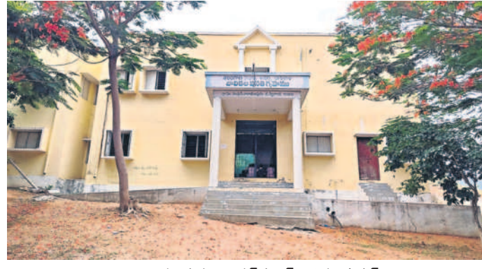
నారాయణపురం మోడల్ స్కూల్ బాలికల హాస్టల్

తెలంగాణ అదర్ల పాఠశాల బాలికల హాస్టల్ సిబ్బందికి ఐదు నెలలుగా జీతాలు రావడం లేదు. కొత్త సర్కారు వచ్చి ఆరు నెలలు దాటితే ఇప్పటి వరకు పైసా ఇవ్వలేదు. జన వర నుంచి వేతనాలు పెండింగ్లో ఉన్నాయని సిబ్బంది వాపోతున్నారు. ఉమ్మడి జిల్లాలో 30 హాస్టల్ ఉండగా, యాదాద్రి భువనగిరిలో ఏడు వసతి గృహాలు ఉన్నాయి. ఒక్కో హాస్టల్లో ఆరుగురు సిబ్బంది పనిచేస్తున్నారు. ఇందులో వార్షిక్, కేరీకర్, ఏఎన్ఎం, హెడ్ కుక్, అసిస్టెంట్ కుక్, వాచ్ మన్ పనిచేస్తున్నారు. వీరంతా ఔట్ సోర్సింగ్ ఉద్యోగులే. ఉమ్మడి జిల్లాలో 197 మంది ఉండగా, యాదాద్రి భువనగిరిలో 42 మంది, నల్గొండలో 101, సూర్యాపేటలో 54 మంది పనిచేస్తున్నారు. సర్కారే అభియాన్ కింద పనిచేస్తున్న వీరంతా జీతాలు కోసం ఎదురుచూస్తున్నారు.