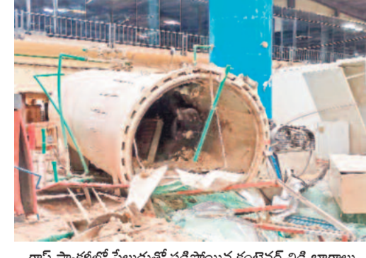
గ్లాస్ ఫ్యాక్టరీలో పేలుడుతో పడిపోయిన కంటైనర్ విడి భాగాలు