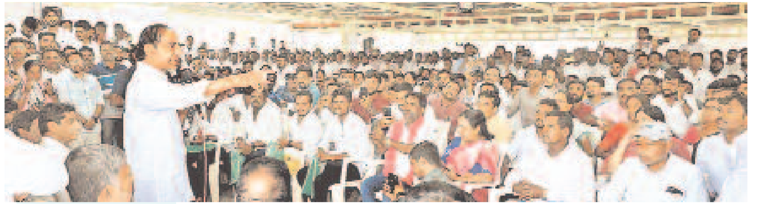
కేసీఆర్ అభిమానులు ఎర్రపల్లికి పోజొత్తుతున్నారు. శుక్రవారం తనను కలిసేందుకు వచ్చినవారితో మాట్లాడుతున్న బీఆర్ఎస్ అధినేత