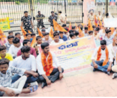
కరీంనగర్ లో భర్తా చేస్తున్న విద్యార్థి నాయకులు

సీఎమ్మార్ ధాన్యం భారీగా గోడవూల్ అయిన విషయాన్ని గుర్తించిన అధికారులు, సదరు యజమానులపై వేర్వేరు పోలీస్ స్టేషన్ లో కేసులు నమోదు చేశారు. జమ్మికుంట మండలం కోరపల్లి శివారులోని మహాశక్తి రైస్ మిల్ లో కోసం సీఎమ్మార్ కింద అప్పగిస్తే.. ఆ వడ్డను బియ్యంగా మార్చి సొమ్ముచేసుకొని ప్రభుత్వానికి సన్న చేశారన్నారు, దీని విలువ ₹62,20,64,821 ఉందంటూ జిల్లా పౌరసరఫరా శాఖ మేనే