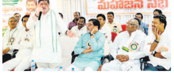
మాట్లాడుతున్న మంత్రి పాస్పాం ప్రభాకర్, వేదికపై కొండూరి

కరీంనగర్, జూన్ 28 (సమస్త తెలంగాణ) : రాజకీయాలకు అతితగా రైతులకు సహకార సేవలు అందించాలని రాష్ట్ర టీసీ సంకేతం, రాజా శాఖ మంత్రి పాస్పాం ప్రభాకర్ సూచించారు. కరీంనగర్ లోని కేడీసీసీ బ్యాంకు కార్యాలయంలో శుభ్రవారం జరిగిన సర్వసంఖ్య సమావేశానికి ఆయన ముఖ్యఅతిథిగా హాజరై మాట్లాడారు. గతంలో కేడీసీసీబీ చైర్మన్ కొండూరు రవీంద్రరావుతో కలిసి తాను జోడెడ్డల్లా సహకార రంగంలో కొంతకాలం నిర్వహించారు. సెంట్రల్ బ్యాంక్ చైర్మన్ కావాలని అనుకున్న తనకు 15 రోజుల్లోనే అప్పటి సీఎం వైసిపి రాజశేఖర్ రెడ్డి మార్కెట్ రెగ్యులేషన్ అవకాశం కల్పించారని గుర్తు చేశారు. ఆ తర్వాత కరీంనగర్ ఎంపీగా ఎన్నికయ్యానని, ఇప్పుడు హుజూరాబాద్ నుంచి ఎమ్మెల్యేగా గెలవడం, తమ పార్టీ అధికారంలోకి రావడం తద్వారా మంత్రి పదవి వచ్చిందని చెప్పారు. తాను ఎంత ఎత్తుకు వెళ్లినా సహకార రంగం నుంచి మొదలైన తన రాజకీయ ప్రస్థానాన్ని మాత్రం ఎన్నటికీ మరిచిపోనని స్పష్టం చేశారు. ఒక రైతుగా తన తండ్రి బండ్లించిన పంట ఉత్పత్తులను విక్రయించేందుకు అనేక కష్టాలు పడేవారని గుర్తు చేశారు. ఇప్పుడు సహకార రంగం ద్వారా పంట ఉత్పత్తులను కొనుగోలు చేసేలా జీవోలను తాము ఇచ్చామన్నారు. సహకార రంగంలో ఎలాంటి సమస్యలున్నా తన దృష్టికి తీసుకురావాలని కోరారు. రాజకీయాల వేరు, సహకార సేవలు వేరని గుర్తించాలని కోరారు. సహకార రంగం ద్వారా సిసిసిల్ చేసే కార్యక్రమాల అడుగుపాటుని మంత్రి హామీ ఇచ్చారు. కేడీసీసీబీ చైర్మన్ రవీంద్ర అధ్యక్షతన జరిగిన ఈ సమావేశంలో వైస్ చైర్మన్ పింగి రమేష్, డి.సి.ఎం.ఎస్ చైర్మన్ పిల్లారాజు, సీఈఓ సత్యనారాయణ, డైరెక్టర్లు పాల్గొన్నారు. ఈ సందర్భంగా మంత్రి పాస్పాం ప్రభాకర్ ను చైర్మన్, డైరెక్టర్లు, బ్యాంకు ఉద్యోగులు ఘనంగా సన్మానించారు.