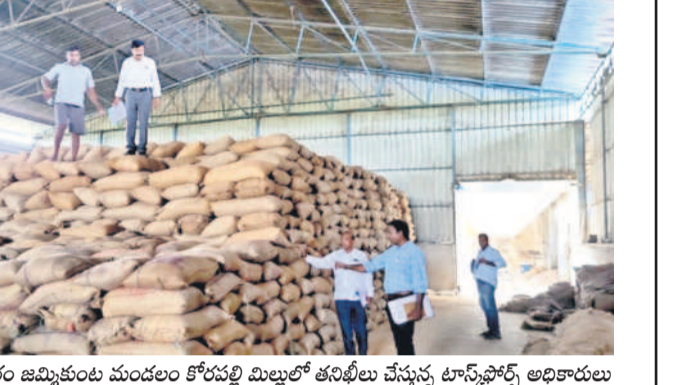
గురువారం జమ్మికుంట మండలం కోరపల్లి మిల్లర్ల తనిఖీలు చేస్తున్న టాస్కోఫోర్స్ అధికారులు

ఉమ్మడి జిల్లాలో మిల్లర్ల అక్రమ దందా ఆగడం లేదు. సీఎమ్మార్ పేరిట అక్రమాలకు ట్రేక్ పడడం లేదు. ప్రభుత్వం ఇచ్చిన అవకాశాన్ని కొంత మంది తమకు అనుగుణంగా మార్చుకొని సొమ్ము చేసుకుంటున్న తీరు.. రాష్ట్ర టాస్కోఫోర్స్ అధికారులు దాడుల్లో బట్టబయలులైంది. కేవలం రెండు మిల్లర్లనే 4.15 లక్షల కింటాక్ష పైబిలుకు ధాన్యం మాయమైనట్లు గుర్తించి, వాటి విలువ ₹130.95 కోట్లకుపైగా ఉన్నట్లు నిర్ధారించారు. అధికారుల ఫిర్యాదు మేరకు జమ్మికుంట మండలం కోరపల్లి శివారులోని మహాశక్తి రైస్ మిల్, ఇల్లందకుంట మండలం శ్రీరాములపల్లిలోని సీతారామ అగ్రో ఇండస్ట్రీస్ యజమానులపై పోలీస్ స్టేషన్ లో కేసులు నమోదు చేశారు. ఈ యజమానులతో అక్రమాల వెలుగు చూడడం కలకలం రేపుతున్నది. మరోవైపు ఈ దందాపై రాష్ట్ర పౌర సరఫరా శాఖ లోతుగా అరాతీస్తు.. పూర్తి అక్రమాలకు అడ్డుకట్ట వేసేందుకు సిద్ధమవుతున్నట్లు తెలుస్తున్నది.