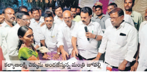
కర్ణాటక లెక్క చెక్కును అందజేస్తున్న మంత్రి జూపల్లి

• రాష్ట్ర ఎక్సైజ్, పర్యాటక మంత్రి జూపల్లి కృష్ణారావు