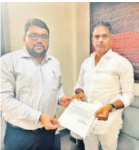
కర్ణాటక ఫిర్యాదు చేస్తున్న మర్రి

ను పెట్టుకోవచ్చని ప్రభుత్వ అధికారులు ఉన్నామన్నారు. ఇందుకుగాను ప్రభుత్వం జీవో నెం-2ను విడుదల చేసిందని, అందులో భాగంగా తమ కంపెనీ నిధుల నుంచి నిర్మించిన పాఠశాల భవనంపై తమ కంపెనీ పేరు పెట్టుకోవడం జరిగిందన్నారు. ప్రారంభోత్సవ సమయంలో తమ కంపెనీ లోగో, పేరు మూసివేసిన వారిపై చర్యలు తీసుకోవాలని కర్ణాటక పరిషత్ చేశారు. ఇందుకు కర్ణాటక సానుకూలంగా స్పందించి చర్యలు తీసుకుంటామని చూపించినట్లు తెలిపారు.