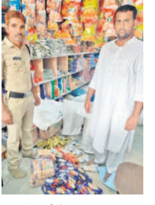
పట్టుబడిన గుట్టా ప్యాకెట్లు

నారాయణపేట, జూన్ 28 : పట్టుబడిన గుట్టా ప్యాకెట్లలో శుక్రవారం పోలీసులు ఓ కరాణం దుకాణంపై దాడులు నిర్వహించి, నిషేధిత గుట్టా ప్యాకెట్లను పట్టుకున్నారు. ఎన్ఫోర్స్ వెంటకర్షణ తెలిపిన వివరాలు ఇలా... పట్టుబడిన ఆరోగ్యకరమైన యూనైటెడ్ కంపెనీ న కరాణం షాపింగ్ అండ్ జ్యూ, గుట్టా ప్యాకెట్లు ఉన్నాయని సమాచారంతో నాడు లు నిర్వహించి, స్వాధీనం చేసుకున్నారు. వాటి లు బల మొత్తం రూ.16,368 ఉంటుందని, యూనైటెడ్ కంపెనీ న సమాధి చేసినట్లు ఎన్ఫోర్స్ తెలిపారు.