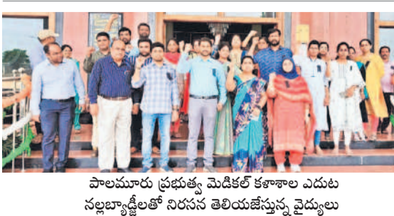
పాలమూరు ప్రభుత్వ మెడికల్ కళాశాల ఎదుట నల్లబ్యాడ్లతో నిరసన తెలియజేస్తున్న వైద్యులు