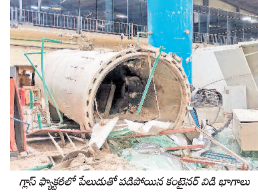
గ్రాన్ ఫ్యాక్టరీలో పేలుడుతో పడిపోయిన కంబైనర్ విడి భాగాలు