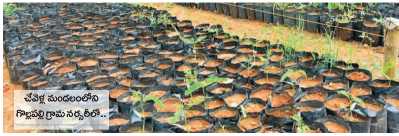
చేపల్లి మండలంలోని కొత్తపల్లి గ్రామ నర్సరీలో..

గత ప్రభుత్వం చేపట్టిన కార్యక్రమాలను అనుభవించే లక్ష్యంగా చేస్తున్న గ్రాంట్ల ప్రభుత్వం తెలంగాణకు పారి