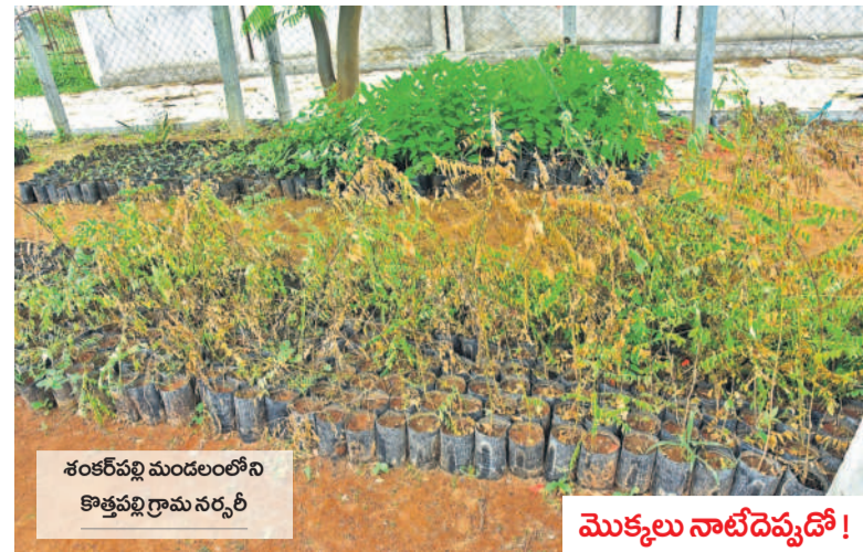
శంకరపల్లి మండలంలోని కొత్తపల్లి గ్రామ నర్సరీ