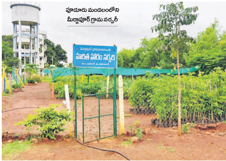
పూర్వ మండలంలోని మిర్చాపూర్ గ్రామ నర్సరీ