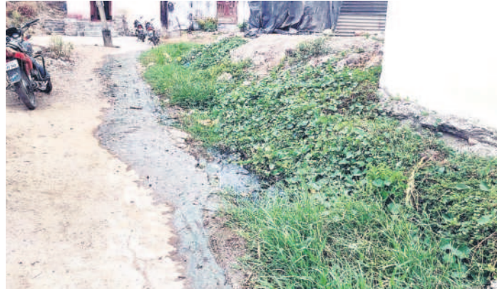
వైసీపీ మండలంలోని కుంసార రోడ్డుపైనే పారుతున్న మురికినీరు