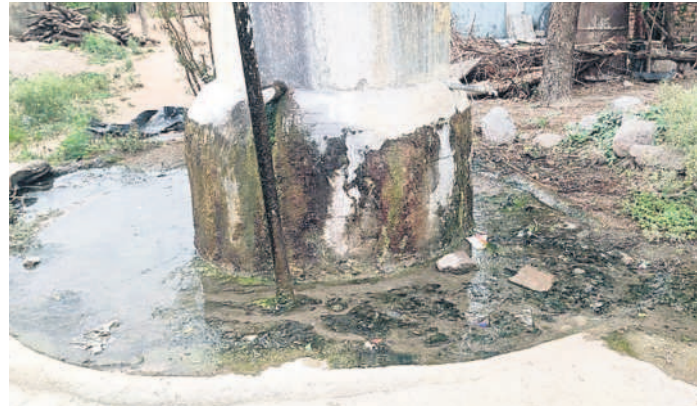
నీరు నిలిచి పారుతున్న నీటిని తాగునీటి బ్యాంకు