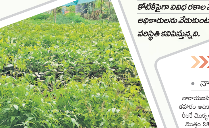
అయిజు నర్సరీలో నాటేందుకు సిద్ధంగా ఉన్న మొక్కలు

"నాలుగు నెలల నుంచి నర్సరీల్లో ఏపుగా పెరిగాం.. రక్షణ కవచంలో ఉన్న మట్టిలోంచి వేళ్లు బయటకొచ్చి నేలలోకి చొచ్చుకుపోతున్నాం.. పక్కపక్కనే మొక్కలు ఉండడంతో పెరుగుదల మందగించింది.. సరైన పోషకాలు అందక ఇక్కడ మగ్గిపోతున్నాం.. కొన్ని నర్సరీల్లో నీళ్లులేక ఎండిపోతున్నాం.. మమ్మల్ని నాటండి మహారాష్ట్ర.. కేసీఆర్ ప్రభుత్వం వర్షాలు ప్రారంభమైన వెంటనే జూన్ లోనే హరితహారం కార్యక్రమాన్ని అట్టహాసంగా నిర్వహించేది.. మాకు స్వేచ్ఛనిస్తూ రోడ్లకిరు వైపులా.. ప్రభుత్వ, ప్రైవేట్ కార్యాలయాలు, ఇండ్లు, ఖాళీ స్థలాల్లో నాటించేటోళ్లు.. కానీ ప్రస్తుతం జూన్ మాసం ముగుస్తున్నా పట్టించుకోవడం లేదు.. రాష్ట్ర ప్రభుత్వానికి పచ్చదనంపై పట్టింపు లేదా..? అంటూ నర్సరీల్లో పెరుగుతున్న కోటికిపైగా వివిధ రకాల మొక్కలు అధికారులను వేడుకుంటున్న పరిస్థితి కనిపిస్తున్నది.