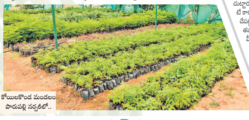
కోయలకోండ మండలం పావుపల్లి నర్సరీలో..

వర్షకాలం ప్రారంభమైనా మొక్కలు నాటే కార్యక్రమాన్ని ప్రారంభించకపోవడంతో ఉమ్మడి జిల్లా వ్యాప్తంగా నర్సరీల్లో మొక్కలు వృధాగా పడి ఉన్నాయి. వానలు కురుస్తుండడంతో నర్సరీలన్నీ పచ్చదనాన్ని సంతరించుకున్నాయి. గతంలో కేసీఆర్ సర్కారు పల్లె, పట్టణ, అడవి ప్రాంతాల్లో నాటడంతోపాటు ఇంటికో మొక్కను అందించేది. దీంతో మహబూబ్ నగర్, వనపర్తి, నాగర్ కర్నూల్ జిల్లా కేంద్రాల పచ్చదనం కళ్ళకలాదుతున్నాయి. ఈసారి హరితహారాన్ని పట్టించుకోకపోవడంతో మొక్కలను నర్సరీల్లోనే సమాధి చేసే పరిస్థితి నెలకొన్నది. ఇప్పటికైనా సర్కార్ హరితహారం చేపట్టాలని డిమాండ్లు వస్తున్నాయి.