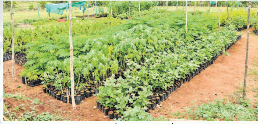
మహబూబ్ నగర్ మండలం దేగడిగడ్డ తండా నర్సరీలో పెరిగిన మొక్కలు

మహబూబ్ నగర్, జూన్ 29 (నమస్తే తెలంగాణ ప్రతినిధి) : పచ్చదనంపై ప్రభుత్వం శీతకన్ను పడింది. వానకాలం ప్రారంభం కాగానే కేసీఆర్ ప్రభుత్వ హయాంలో యజ్జులూ హరితహారం జరిగింది. కానీ ప్రస్తుత ప్రభుత్వ హయాంలో నీలినీడలు కమ్మకున్నాయి. జూన్ దాటుతున్నా ఇంకా మొక్కలు నాటే కార్యక్రమాన్ని ప్రారంభించకపోవడంతో నర్సరీల్లో మొక్కలు వెల్లువెత్తుతున్నాయి. ఉమ్మడి జిల్లా వ్యాప్తంగా వర్షాలు పడుతున్నాయి. ఈ సమయంలో మొక్కలు నాటే పెరిగేందుకు మంచి అవకాశంగా చెప్పొచ్చు. కానీ కాంగ్రెస్ సర్కారు ఈ కార్యక్రమంపై ఇప్పటివరకు ఎలాంటి ఆదేశాలు ఇవ్వలేదంటూ 1720 నర్సరీల్లో 1.28 కోట్ల మొక్కలు ఏపుగా పెరిగి వృధాగా ఉండిపోయే పరిస్థితి దాపుంచెందింది. మమ్మల్ని నాటండి.. అంటున్న మొక్కల వేదన కనిపిస్తుంది. 'నమస్తే తెలంగాణ' బ్యూరో ఉమ్మడి మహబూబ్ నగర్ జిల్లాలోని నర్సరీల పరిస్థితిపై ఫోటోస్ పెట్టింది. కేసీఆర్ ప్రభుత్వం హరితహారం కార్యక్రమాన్ని ప్రతిష్టాత్మకంగా నిర్వహించింది. ఎక్కడ ఏ కార్యక్రమం జరిగినా మొక్కలు నాటి శ్రీకారం చుట్టారు. అంతేకాకుండా గ్రీన్ చాలెంజ్ పేరుతో నిలబెట్టిన సైతం ఇందులో భాగస్వామ్యం చేసేవారు. కాగా, కొత్తగా వచ్చిన ప్రభుత్వం మాత్రం పచ్చదనంపై ఇంకా విధివిధానాలు రూపొందించలేదు. దీంతో వర్షకాలం ప్రారంభమైన కోట్లాది మొక్కలు నర్సరీల్లోనే మగ్గిపోతున్నాయి.