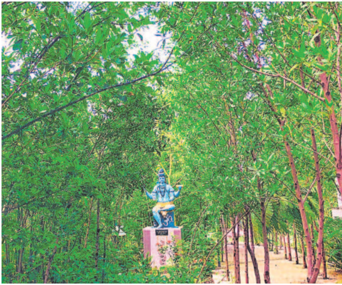
అదిలాబాద్ జిల్లా ఇప్పోడ మండలం ముక్కా(కే) గ్రామంలోని వైకుంఠధామంలో గ్రీన్ ఇండియా చాలెంజర్ భాగంగా పెద్ద సంఖ్యలో మొక్కలు నాటారు. ప్రస్తుతం అవి పెద్దగా ఎదిగి అక్కడి భోజా శంకరుడి విగ్రహం చుట్టూ వచ్చని తోరణంగా మారాయి.