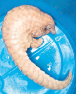
రామస్థల పట్టుకున్న అడవి వాలుగ (అలుగు)