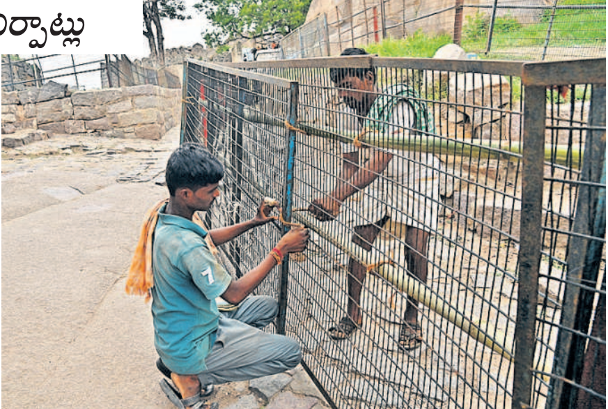
బోనాలు అంటే టప్పుల గుర్తు కొచ్చేది గోల్కొండ బోనాలు. అంత ప్రాచూరం పొందింది గోల్కొండ కోట. శుభవారం సుంది ప్రారంభం కానున్న ఆషాఢ మాస బోనాలకు గోల్కొండ కోట ముస్లింపులకున్నది. దానిలో భాగంగా జూలై మొదటి అదివారం సుంది ప్రారంభం కానున్న బోనాల వేడుకలకు వచ్చే భక్తులకు ఎలాంటి ఇబ్బందులు తలెత్తకుండా ఉండేందుకు ముమ్మర ఏర్పాట్లు చేస్తున్నారు.