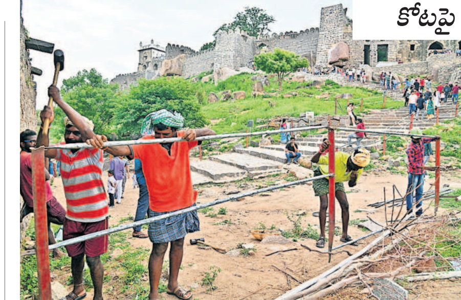
బోనాలు అంటే టప్పుల గుర్తు కొచ్చేది గోల్కొండ బోనాలు. అంత ప్రాచూరం పొందింది గోల్కొండ కోట. శుభవారం సుంది ప్రారంభం కానున్న ఆషాఢ మాస బోనాలకు గోల్కొండ కోట ముస్లింపులకున్నది. దానిలో భాగంగా జూలై మొదటి అదివారం సుంది ప్రారంభం కానున్న బోనాల వేడుకలకు వచ్చే భక్తులకు ఎలాంటి ఇబ్బందులు తలెత్తకుండా ఉండేందుకు ముమ్మర ఏర్పాట్లు చేస్తున్నారు.

బోర్డు అభివృద్ధి కృషి చేయండి రాష్ట్ర గవర్నర్ సీపీ.రాధాకృష్ణను రాజీభవనంలో అదివారం కంటోన్మెంట్ కాంగ్రెస్ పార్టీ సీనియర్ నాయకులు మర్యాద పూర్వకంగా కలిశారు. ఈ సందర్భంగా కేంద్ర రక్షణ మంత్రిత్వ శాఖ నుంచి కంటోన్మెంట్ బోర్డుకు రావాల్సిన వివిధ సత్వన వార్షిక వివరాలు, బోర్డులో కంటోన్మెంట్