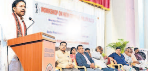
వర్క్ షాప్ లో మాట్లాడుతున్న కేంద్రమంత్రి కిషన్ రెడ్డి

హిమాయత్ నగర్, జూన్ 30: మార్కులకు అనుగుణంగా ఆధునిక సాంకేతికతను అందించుకోవాలని కేంద్ర మంత్రి జి.కె.వి.రెడ్డి అన్నారు. ఫోటో ఫర్ నేషనల్స్ డింకర్స్ అధ్యక్షులలో అదివారం నారాయణగూడ కేవలమెవారిలో ఆడిటోరియంలో 'సూక్ష్మ క్రిమినల్ మేజర్ యాక్ట్' అంశంపై వర్క్ షాప్ జరిగింది. మంత్రి కిషన్ రెడ్డి మాట్లాడుతూ దేశ అవసరాలను బట్టి చట్టాలను మార్చుకోవాలని అవసరం ఉంటుందన్నారు. దేశంలోని బాంబే ముంబై, కలకత్తాను కోల్కతా, మద్రాసును చెన్నైగా మార్చారని అన్నారు. అదే బీజేపీ అధ్యక్షులలో మార్కుల వేషే మాత్రం వ్యతిరేకించేవారినీ ఆరోపించారు. దేశంలో అందరినీ పరిగణించి తీసుకుని చట్టాల్లో మార్పులు చేసేట్లు పేర్కొన్నారు. ఇప్పటికీ బ్రిటిష్ చట్టాలనే అనుసరిస్తున్నామని, వారి చట్టాలను ఎందుకు కొనసాగించాలని ప్రశ్నించారు. ప్రధాని మోడీ దేశానికి మేలు జరిగేలా చట్టాల్లో మార్పులు తీర్చేందుకు కృషి చేస్తున్నారని వివరించారు. ఇండియా గేట్ వద్ద కొందరు బ్రిటిష్ వాళ్ల పగ్గరకు ఉంటే వాటిని తొలగించి సుభాష్ చంద్రబోస్ విగ్రహాన్ని ఆవిష్కరించామని వివరించారు. తిక్కాజీ