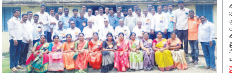
ఉపాధ్యాయులతో 1996-97 బ్యాచ్ విద్యార్థులు

కుంటాల, జూన్ 30 : కుంటాలలోని జిల్లా పరిషత్ ఉన్నత పాఠశాలలో 1996-97, 1999-2000 పదో తరగతి బ్యాచ్ పూర్వ విద్యార్థులు ఆదివారం అత్యున్నత సమైక్య సమావేశం నిర్వహించారు. పాఠశాల క్లాస్ రూమ్ లు, ఆవరణలో పోటోలు దిగి జ్ఞాపకాలను గుర్తు చేసుకున్నారు. ఆనంతరం పూర్వ ఉపాధ్యాయులను సన్మానించారు.