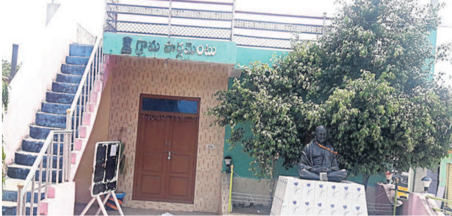
నార్సూర్ గ్రామ పంచాయతీ కార్యాలయం