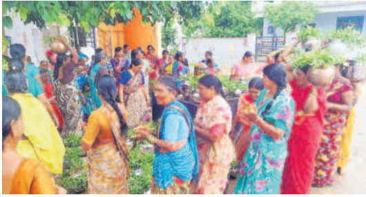
ఆరెగూడెంలో బోడ్రాయికి పూజలు చేస్తున్న మహిళలు