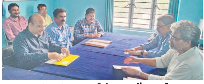
జిల్లాలో తొలి కేసు సమాధి..

నిర్మల్ అర్బన్, జూలై 1 : దేశవ్యాప్తంగా అమలు చేసిన నూతన చట్టాలతో కేసుల దర్యాప్తు వేగవంతం, బాధితులకు నష్టం జరగుతుందని ఎమ్మెల్యే జానకి పద్మిని అన్నారు. సోమవారం నూతన చట్టాల అమలులో భాగంగా నిర్మల్ జిల్లాలోని లక్ష్మణాచార్య పోలీస్ స్టేషన్లో కొలి కేసును సమాధి చేసినట్లు ఆమె తెలిపారు. ఈ సందర్భంగా ఎమ్మెల్యే మాట్లాడుతూ.. నూతన చట్టాల దర్యాప్తు విధానం, విచారణ పద్ధతుల్లో మార్పు వస్తుందని, ప్రజలకు సమర్థవంతంగా సత్వర సేవలు అందించే అవకాశం ఉందని తెలిపారు.