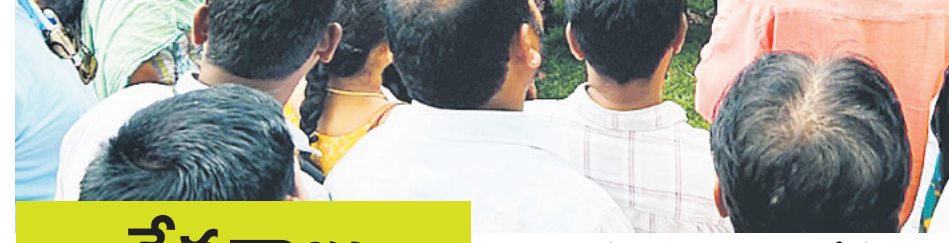
వన మహోత్సవంలో భాగంగా మావలలోని హరితవనం, అర్బన్ పార్కులో మంత్రి సీతక్క మొక్కలు నాటారు.