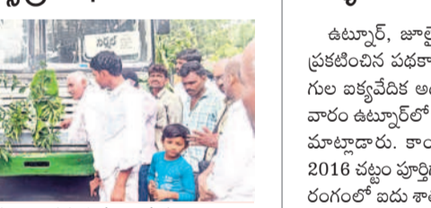
బస్సుకు తోరణాలు కడుతున్న గ్రామస్థులు

బోఫ్, జూలై 1: బోఫ్-నిగిని మధ్యలో నడిచే బస్సును సోమవారం నిర్వహణలో అధికారులు ప్రారంభించారు. బోఫ్ నుంచి నిగిని వరకు ఉదయం, సాయంత్రం సమయాల్లో ట్రిపులు నడిచే విధంగా సమయానుసారం రూపొందించారు. డ్రైవర్, కండక్టర్లు శాలువాలతో సన్మానించారు. కార్యక్రమంలో గ్రామస్థులు పాల్గొన్నారు.