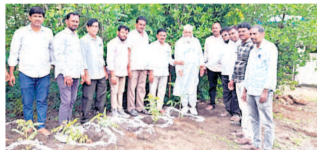
తాంసి: కోలూర్ క్రీడా ప్రాంగణం వద్ద మొక్కలు నాటుతున్న అధికారులు