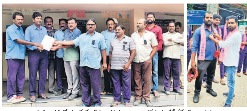
భూపాలపల్లిలో గని మేనేజర్ కు వినపత్రాన్ని అందజేస్తున్న టీటీజీకేఎస్ నాయకులు

హనుమకొండ చౌరస్తా, జూలై 1: నిరుద్యోగులు రోడ్లెక్కి నిరసన తెలుపుతున్నారు. డిఎస్సీ వాయిదా వేయాలని డిమాండ్ చేశారు. ఈ మేరకు సోమవారం హనుమకొండలోని జిల్లా కేంద్ర గ్రంథాలయం ఎదుట అభ్యర్థులు బైరాయింది ఆందోళన నిర్వహించారు. ఈ సందర్భంగా ప్రభుత్వానికి వ్యతిరేకంగా నివాదాలు చేశారు. డిఎస్సీ పోస్టులు 25వేలకు పెంచాలని డిమాండ్