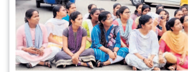
డిఎస్సీ పరిశ్రమ వాయిదా వేయాలని డిమాండ్ చేస్తూ కొండలోని జిల్లా కేంద్ర గ్రంథాలయం ఎదుట రోడ్డుపై బైరాయింది నిరసన తెలుపుతున్న అభ్యర్థులు