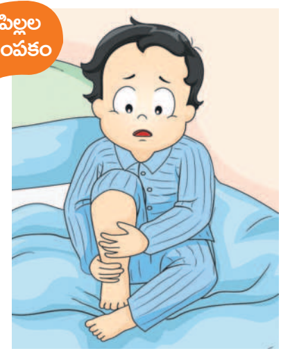
టీసీ అయి ఉంటుంది. ఆలస్యం చేయకుండా ఒక సారి పీడియాట్రిషియన్ ను సంప్రదించండి. వాళ్లు చెప్పిన పరీక్షలు చేయించండి. దానికి అనుగుణంగా మందులు వాడుతూనే ఫిజియోథెరపీ చేయించండి. మీ అబ్బాయికి ఉన్న లక్షణాలకు ఎటువంటి ప్రమాద కారణాలు లేవని నిర్ధారించుకోవాలి అవసరం ఉంది. ఒక సారి పీడియాట్రిక్ న్యూరాలజిస్టు కలవండి. వైరస్ ఇన్ ఫ్లూంజా వల్ల నరాలు కూడా ప్రభావితం అవుతాయి. ఆ సమస్యకు కారణం ఏమిటనేది పరీక్షల ద్వారానే నిర్ధారణ అవుతుంది. అప్పుడు కచ్చితమైన మందులు వాడి సమస్య నుంచి బయటపడవచ్చు.

నడుస్తూ, పరుగుడుతూ ఉన్న బిడ్డ నడవలేక పోవడం ఏ తల్లిదండ్రులకైనా ఆందోళన కలిగిస్తుంది. మీరు చెప్పిన వివరాల ప్రకారం... మొదట జలుబు, దగ్గుతో బాధపడ్డాడు. అలాగే కండరాల నొప్పి, దానివల్ల నడవలేక ఇబ్బంది పడుతున్నాడని చెప్పారు. మీ అబ్బాయికి వైరల్ ఇన్ ఫ్లూంజా ఉంది. వైరల్ ఇన్ ఫ్లూంజా వల్ల మయోసైటిస్ సమస్య రావచ్చు. వైరస్ లు ఏ విధంగా జలుబు, గొంతునొప్పి, ఒంటినొప్పిలు కలుగజేస్తాయో, అలాగే కండరాలపై ప్రభావం చూపిస్తాయో, వైరస్ ల వల్ల కండరాల వాపు, నొప్పి కలుగుతుంది. అందువల్ల నడవలేకపోతారు. మీ అబ్బాయి సమస్య ఇదే అయి ఉంటే పూర్తిగా నయమవుతుంది. దీనికి సీసీటి అనే ఎంజైమ్ టిప్స్ చేయించుకోవడం మంచిది.