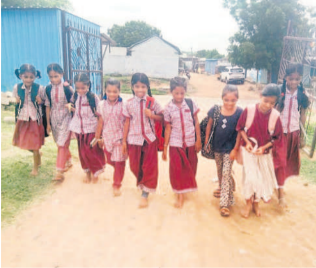
సారంగాపూర్ మండలం జెవులి గ్రామానికి బస్సు సౌకర్యం లేకపోవడంతో కాలినడకన స్వర్ణ పాఠశాలకు వెళ్తున్న విద్యార్థినులు

ఆదిలాబాద్ జిల్లావ్యాప్తంగా పలు గ్రామాలకు బస్సు సౌకర్యం లేక విద్యార్థులు అవస్థలు పడుతున్నారు. జిల్లా, మండల కేంద్రాలు, ఆయా గ్రామాలలోని ప్రభుత్వ పాఠశాలల్లో చదువుకునే విద్యార్థులు రోజు తమ సొంత గ్రామాల నుంచి బడికి వెళ్లి వస్తుంటారు. ఇందుకోసం విద్యార్థులు ప్రధానంగా అక్కడి బస్సులపైనే ఆధారపడుతారు. మారుమూల గ్రామాలలోపాటు మహారాష్ట్ర సరిహద్దు గ్రామాలు, ఉట్టూర్, ఇంద్రవల్లి, నార్కట్ పల్లి, గాడిగూడ, సిరికొండ వంటి ఏజెన్సీ మండలాలలోని గ్రామాల విద్యార్థులు రవాణా పరమైన ఇబ్బందులు ఎదుర్కొంటున్నారు. అక్కడి బస్సు సౌకర్యం లేకపోవడంతో ప్రైవేటు వాహనాలను ఆశ్రయిస్తున్నారు. రవాణా సౌకర్యం లేక పాఠశాలకు అలస్యంగా వస్తున్నారు. బడికి సమయానికి చేరుకోవడం కోసం ఆటోలో వేలాడుతూ ప్రయాణం చేస్తున్నారు. దీంతో ఎప్పుడు ఏ ప్రమాదం ముంచుకొస్తుందో తెలియని పరిస్థితి నెలకున్నది. ఉదయం బడికి పోయేటప్పుడు, సాయంత్రం బడి నుంచి వచ్చేటప్పుడు విద్యార్థులకు ఆటోలో ప్రయాణం చేయాల్సి వస్తున్నది. అధికారులు స్పందించి తమ విద్యార్థుల పాఠశాల సమయాల్లో బస్సులు నడుపాలని విద్యార్థుల తల్లిదండ్రులు కోరుతున్నారు.