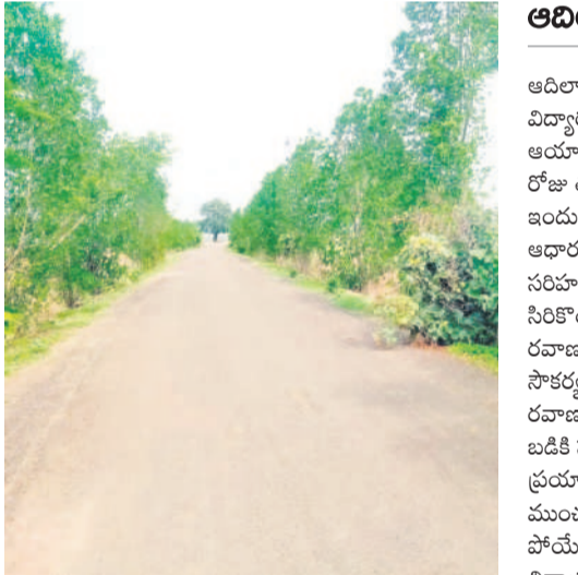
తానూర్ మండలం ఉప్పు(కే) గ్రామానికి తారు రోడ్లు ఉన్నా బస్సు సౌకర్యం లేదు..