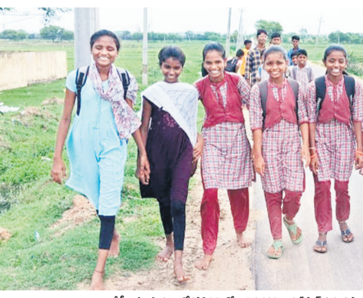
అక్కడి బస్సు సౌకర్యం లేకపోవడంతో కాలినడకన వానల్ పాద్ ఉన్నత పాఠశాలకు వెళ్తున్న జైంసా మండలంలోని వట్టి, పేదపల్లి గ్రామాలకు చెందిన విద్యార్థులు

నిర్మల్/ఆదిలాబాద్, జూలై 2(నమస్తే తెలంగాణ) : విద్యార్థిభృద్ధికి కోట్లాది రూపాయలు ఖర్చు చేస్తున్నామని చెబుతున్న కాంగ్రెస్ ప్రభుత్వం.. ఆవరణలో మాత్రం నిర్లక్ష్య ధోరణి అవలంబిస్తున్నదన్న ఆరోపణలు ఉన్నాయి. కొద్దిపాటి ఖర్చుకు వెనుకాడుతుండడంతో ప్రభుత్వ పాఠశాలకు దూరంగా ఉన్న పేద విద్యార్థులు చదువుకు నోచుకోలేకపోతున్నారు. వీరికి విద్యాసౌఖ్య రవాణా సౌకర్యం కల్పిస్తున్నట్లు చెబుతున్నా.. ఆవరణలో అమలు కావడం లేదు. జిల్లా వ్యాప్తంగా చాలా గ్రామాలకు తారురోడ్లు ఉన్నప్పటికీ బస్సులు నడవడం లేదు. దీంతో విద్యార్థులు సమీప గ్రామాలలోని పాఠశాలకు కాలి నడకన, ప్రైవేటు వాహనాల్లో వెళ్లాల్సి వస్తున్నది. అలాగే మరొకటి గ్రామాలకు సమీపంలోని లేకుండా బస్సులు నడవడం వల్ల విద్యార్థులు ప్రభుత్వ పాఠశాల చదువులకు దూరమయ్యే పరిస్థితులు ఎదురవుతున్నాయి. కొన్ని చోట్ల ప్రభుత్వ పాఠశాల ఉపాధ్యాయలే స్వచ్ఛందంగా ఆటో రిక్షాలను ఏర్పాటు చేసి విద్యార్థులను రప్పిస్తున్నారు. చాలా గ్రామాలకు రవాణా సౌకర్యం, బస్సుల రాక విద్యార్థులు ప్రభుత్వ విద్యకు దూరమవుతున్నారు. ఈ అవకాశాన్ని ఆసా చేసుకుని ప్రైవేట్ పాఠశాలలు ఊరూరా తమ బస్సులను నడుపుతూ విద్యార్థులను తమ పాఠశాలలో చేర్చుకుంటున్నాయి. ప్రభుత్వం స్పందించి అన్ని గ్రామాలకు అక్కడి బస్సు సౌకర్యాన్ని కల్పించాలని కోరుతున్నాం. ఉదయం, సాయంత్రం ప్రత్యేక బస్సులను నడిపితే విద్యార్థులు సౌకర్యవంతంగా ఉంటుంది. ప్రభుత్వం ఈ దిశగా దృష్టి కేంద్రీకరించాలని విద్యార్థులు, వారి తల్లిదండ్రులు కోరుతున్నారు.