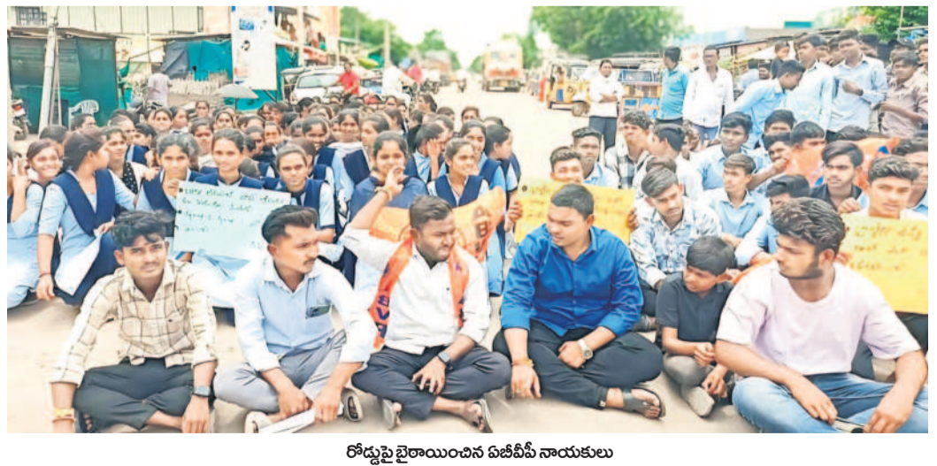
రోడ్డుపై రైతలయించిన ఓటవీపీ నాయకులు

చెప్పిన రేవంత్ రెడ్డి రైతులను మళ్లీ పెడుతున్నారన్నారు. తెల్లరేషన్ కార్డు, కుటుంబంలో ఒక్కరికి వంటి నిబంధనలు రైతులకు శాపంగా ఉన్నాయని మండిపడ్డారు. అర్హులైన రైతులందరికీ ఈ పథకాలు అందజేయాలన్నారు. రాష్ట్రంలో పాలనను పక్కనే పెట్టి ఢిల్లీ యాత్రలు చేస్తున్నారన్నారు. రైతుభరోసా విషయంలో వ్యవసాయశాఖ అండ్ తుమ్మల నాగేశ్వరరావు వ్యాఖ్యలు సరికాదన్నారు. బీఆర్ఎస్ ప్రభుత్వం రాళ్లు, రచ్చలు, సాగులో లేని భూములకు రైతుబంధు ఇచ్చిందని అంటున్నాడు. అప్పుడు మంత్రిగా ఉన్న తుమ్మల అమలు చేయకపోతే అందోజు చేస్తామని హెచ్చరించారు. ఈ సమావేశంలో బీఆర్ఎస్ నెల రోజులు దాటిగా రైతుభరోసా అందలేదని, రూ.రెండు లక్షల రుణమాఫీ చేస్తామని