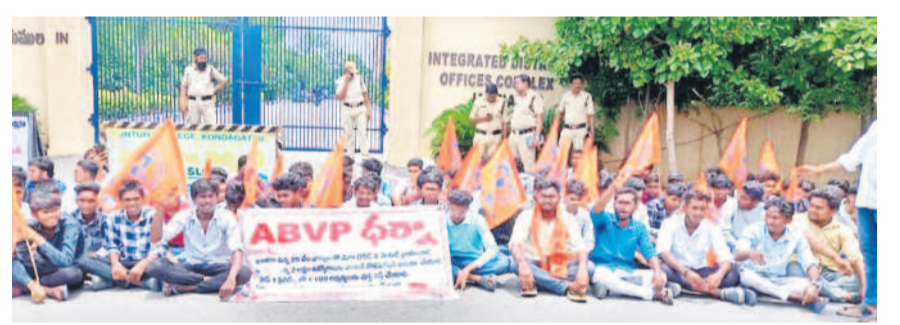
జగిత్యాల జిల్లా కలెక్టరేట్ ఎదుట ధర్నా చేస్తున్న ఏబీవీసీ నాయకులు, విద్యార్థులు

కరీంనగర్ కలెక్టరేట్, జూలై 2: విద్యారంగ సమస్యలను పరిష్కరించాలని, ప్రభుత్వ విద్యా సంస్థల్లో మెరుగైన పనితీరును నిర్వహించాలని డిమాండ్ చేశారు. విద్యారంగ సమస్యలను పరిష్కరించాలని విద్యార్థులకు 25 శాతం ఉచిత విద్యను అందించాలని సమావేశం, ప్రైవేట్, కార్పొరేట్ విద్యాసంస్థల్లో ఫీజు డోపి డీని అరికట్టాలన్నారు. హాస్టల్ మెసార్లకు పెంచాలని, కేసీఆర్ లో విద్యాశాఖ మంత్రిని నియమించాలని కోరారు. లేనివరకు విద్యారంగ నిర్వహణలో రాష్ట్ర ప్రభుత్వం బాధ్యత వహించాల్సి ఉంటుందని హెచ్చరించారు.