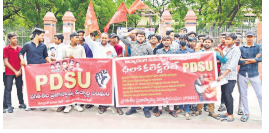
కరీంనగర్ కలెక్టరేట్ ఎదుట ధర్నా చేస్తున్న విద్యార్థి సంఘం నాయకులు

దళితుడిననే చిన్నచూపు నేను దళితుడిననే చిన్నచూపు చూశారు. నా జాతికి న్యాయం చేయాలనే నిశ్చయంతో జడ్పీ సర్వసభ్య సమావేశానికి డీ పర్ల వెళ్తున్నా వేళ్ల కనీసం గేటు దగ్గరకి కూడా రానియ్యకుండా పోలీసులు అడ్డుకున్నారు. ఇది చివరి సమావేశమని, చివరి సాక్షిగా అందరం కలుసుకుంటున్నామని ఎంత బతిమలాడినా కరీంనగర్ ఏసీబీ నన్ను లోనికి అనుమతించలేదు. పార్లమెంట్, అసెంబ్లీకి వెళ్లేటప్పుడు ఆయా పార్టీల ఎమ్మెల్యేలు కందువారు కప్పుకొని పోతారు. ప్రజల సమస్యలను ఏకరువు పెట్టడానికి కొన్ని సమానాలు తీసుకెళ్లారు. జిల్లా స్థాయిలో ఇది కూడా ఒక సభ అయినందున నేను ఈ రకమైన డీ పర్లను ధరించి వెళ్తా. ఇది నేను చేసినా తప్పా? దళితబంధు రెండో విడుదల డబ్బులు విడిపించుకోకుండా కాంగ్రెస్ ప్రభుత్వం కావాలనే ఆంక్షలు విధిస్తున్నది. నాకు అవమానం జరిగినా పర్లా లేదు కానీ, నా జాతికి అవసరమైన గ్రాంట్ ను విడుదల చేయాలి.