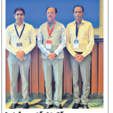
సెంట్రల్ ఎలక్ట్రానిక్స్ లిమిటెడ్

అర్ధికం 53వ జీఎస్టీ సమావేశం స్టీల్, ఐరన్, అల్యూమినియం, పాల క్యాన్సు తదితరాలపై 12% జీఎస్టీ విధించాలని జీఎస్టీ మండలి తన 53వ సమావేశంలో నిర్ణయించింది. అలాగే ఈ సమావేశంలో పలు కీలక నిర్ణయాలు కూడా తీసుకున్నారు. అవి.. రైల్వేల ద్వారా సాధారణ పౌరుడికి అందే సేవలనుంచి జీఎస్టీ మినహాయింపు, ఉదాహరణకు షాట్ఫాం టిక్కెట్లు, వెయిటింగ్ రూమ్స్ తదితరాలు చిన్న పన్ను చెల్లింపుదారుల ప్రయోజనం కోసం జీఎస్టీఆర్-4ను ఏప్రిల్ 30 నుంచి జూన్ 30 వరకు పొడిగించారు.