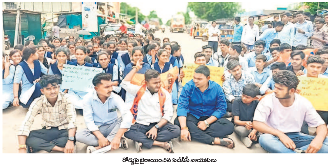
రోడ్డుపై రైతలయించిన ఓటవీపీ నాయకులు

చెప్పిన రేవంత్ రెడ్డి రైతులను మళ్లీ మోసం చేస్తున్నారన్నారు. తెలంగాణలో ఒక్కరికే వంటి నిబంధనలు రైతులకు కాకుండా ఉన్నాయని మండిపడ్డారు. అర్హులైన రైతులందరికీ ఈ పథకాలు అందజేయాలన్నారు. రాష్ట్రంలో పాలనను పక్కనే పెట్టి ఢిల్లీ యాత్రలు చేస్తున్నారన్నారు. రైతుభరోసా విషయంలో వ్యవసాయశాఖ అండ్ తుమ్మల నాగేశ్వరరావు వ్యాఖ్యలు సరికావడం లేదు. బీఆర్ఎస్ ప్రభుత్వం రాళ్లు, రచ్చలు, సాగులో లేని భూములకు రైతుబంధు ఇచ్చిందని అంటున్నాడు. అప్పుడు మంత్రిగా ఉన్న తుమ్మల అమలు చేయడంతో అందోకపోతే అందోకపోతే హెచ్చరించారు. ఈ సమావేశంలో బీఆర్ఎస్ నెల రోజులు దాటిగా రైతుభరోసా అందలేదని, రూ.రెండు లక్షల రుణమాఫీ చేస్తామని