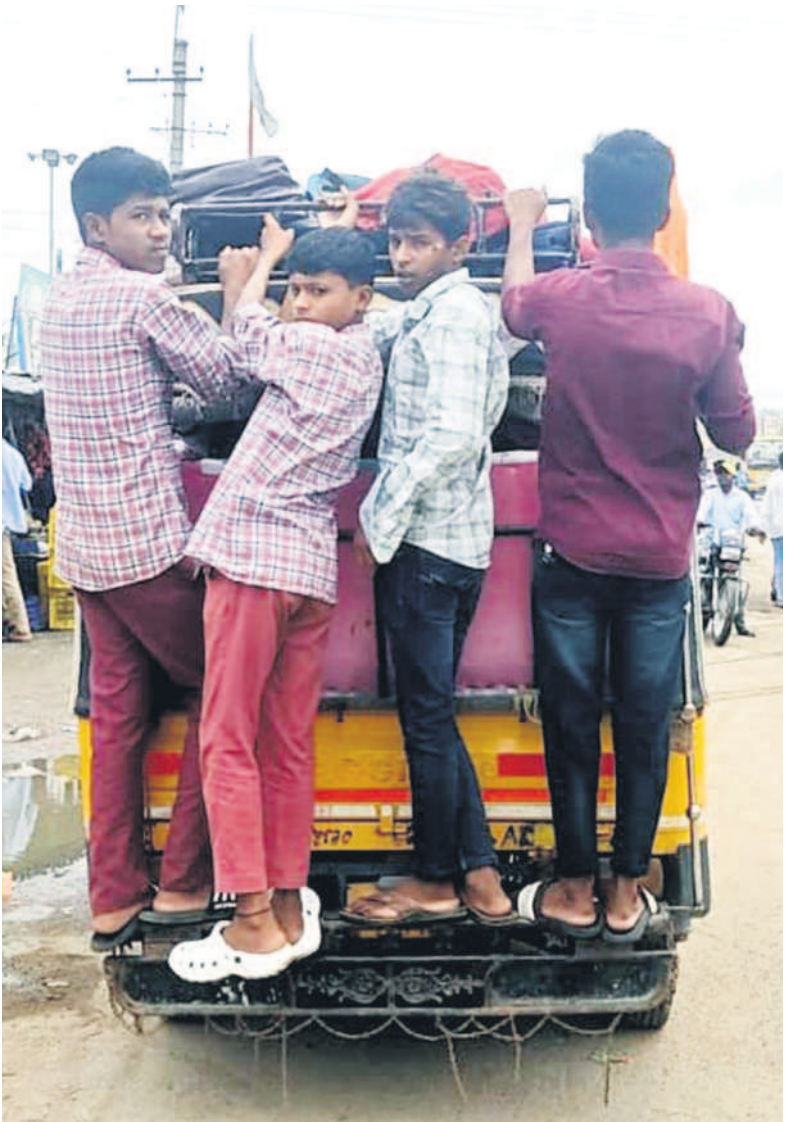
ఇచ్చేడ(సిరికొండ) : ఆయా గ్రామాల నుంచి ఇచ్చేడకు ఆటోలో వేలాడుతూ పాఠశాలకు వస్తున్న విద్యార్థులు

5 నిజామాబాద్, బుధవారం 3 జూలై 2024 ADILABAD NIRMAL