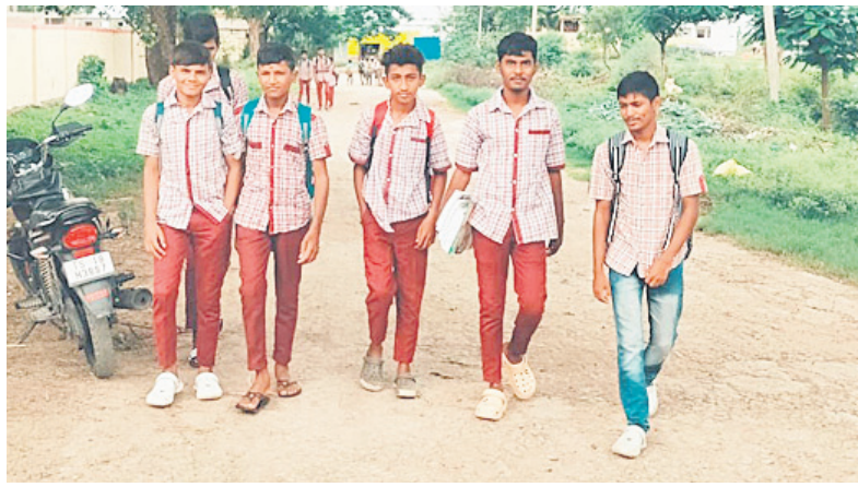
కుభేర్ మండలంలోని రాజార-చాంది గ్రామాలకు బస్సు సౌకర్యం లేకపోవడంతో కాలినడకన వెళ్తున్న విద్యార్థులు