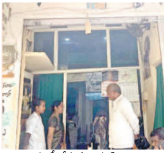
తనిఖీ చేస్తున్న వైద్య సిబ్బంది

ఎదులాపురం, జూలై 2 : ఆదిలాబాద్లో కొందరు ఆర్ఎంపీలు నిర్వహిస్తున్న వైద్యశాలలో నిబంధనలకు విరుద్ధంగా వైద్యసేవలు అందించడంపై వివరిస్తూ నమస్తే తెలంగాణలో జూలై 1వ తేదీన ప్రచురితమైన అక్కడ ఆర్ఎంపీలపై ఎంపీటీసీలను కడపనాటి జిల్లా వైద్యశాల అధికారులు స్పందించారు. పట్టణంలోని శివాజీచౌక్ సమీపంలోని ఆదిలాబాద్ ప్రాంతంలో ఆదిలాబాద్ క్లినిక్లకు నోటీసులు తనిఖీ చేసే పనియందు కేంద్రంలో ఆంధ్రప్రదేశ్ సేవల కంట్రీ టోగ్రూపును ప్రభావితం చేసే అంశాలను గుర్తించారు. క్లినిక్ నిర్వాహకులు నోటీసులు జారీ చేయ