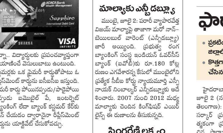
సఫిరో ఫారెక్స్ కార్డ్

హైదరాబాద్, జూలై 2 : దేశీయ వైబెట్ రంగ బ్యాంకింగ్ సంస్థ ఐసీఐసీఐ బ్యాంక్. మంగళవారం సెబీ నోటీసులు జారీ చేసింది. ఈ విషయంలో కొటక్ బ్యాంక్ ప్రస్తావనను హిందెన్బర్గ్ ఉటంకించడం ప్రస్తుతం చర్యనియాంశంగా మారింది.