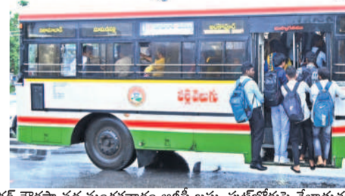
నిజామాబాద్ జిల్లా మాక్లూర్ మండలం దాననగర్ చౌరస్తా వద్ద మంగళవారం ఆర్టీసీ బస్సు పుట్టబోస్తున్న వేలాడుతూ ప్రయాణిస్తున్న విద్యార్థులు, బస్సులు సరైన సమయానికి రాకపోవడంతో ఆటోలో కిక్కిరిసి వెళ్ళుతున్న విద్యార్థులు