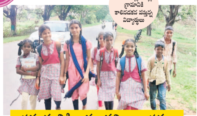
సమయానికి రావు.. వచ్చినా ఆపారు..

ఎల్లారెడ్డి, జూలై 2 : ఎల్లారెడ్డి మండలంలోని చాలా గ్రామాల్లో విద్యార్థులు పాఠశాలకు వెళ్ళేందుకు నాలుగు నుంచి ఆరు కిలోమీటర్ల దూరం ప్రతిరోజూ నడక తప్పడం లేదు. సమయం మెడకే వెళ్ళే ఆర్టీసీ బస్సు సమయానికి రాకపోవడంతో వందలాది మంది ప్రభుత్వ పాఠశాల విద్యార్థులు ఆపారు పడుతున్నారు.