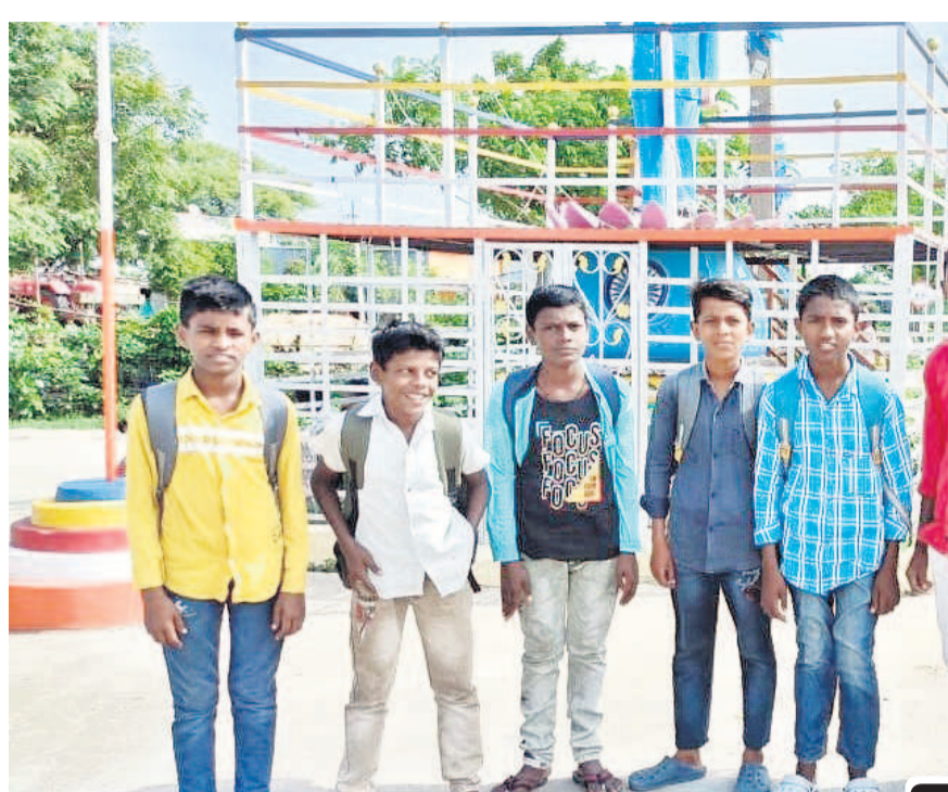
బోధన్ మండలంలోని ఖండీగాండ్లో బస్సు కోసం ఎదురు చూస్తున్న విద్యార్థులు