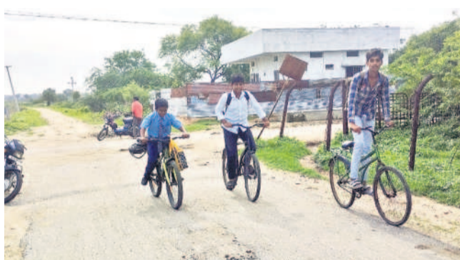
శక్కడనగర్లోని మధ్యమండలం హైస్కూల్కు సైకిల్స్ వెళ్ళుతున్న విద్యార్థులు