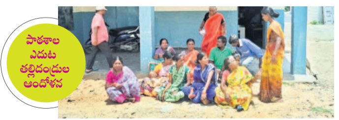
పాఠశాల ఎదుట ధర్నాకు దిగిన విద్యార్థుల తల్లిదండ్రులు