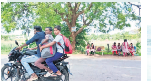
బస్సు కోసం బస్టాండ్లో విద్యార్థులు, సమయానికి బస్సు సౌకర్యం లేకపోవడంతో లిఫ్ట్పై పాఠశాలకు వెళ్ళుతున్న విద్యార్థులు

వేలూర్, జూలై 2 : వేలూర్ మండలంలోని అమీనాపూర్, వాడి, కొత్తపల్లి, సాహెబ్పేట్ గ్రామాలకు చెందిన విద్యార్థులు పైచదువులకు ఇతర గ్రామాలకు వెళ్ళాల్సిందే. ఈ గ్రామాలనుండి బస్సు సౌకర్యం లేకపోవడంతో సుమారు రెండు, మూడు కిలోమీటర్ల దూరం నడచాల్సిన పరిస్థితి బస్సు నడిపే ప్రాంతం గుండా వెళ్ళామనుకున్నా.. ఆ బస్సులు సమయానికి రాకపోవడంతో గత్యంతరం లేక ఇలా లిఫ్ట్ (ఇతరుల బైక్)ను ఆశ్రయించక తప్పదు.