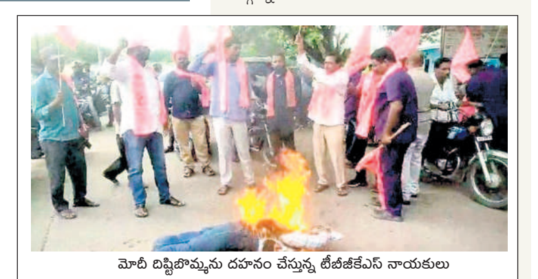
మోదీ దిష్టిబొమ్మను దహనం చేస్తున్న టీజీఎస్ఎస్ నాయకులు