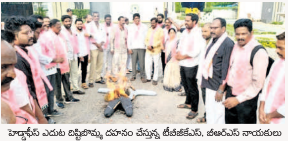
హెడ్కవర్షి ఎదుట దిష్టిబొమ్మ దహనం చేస్తున్న టీజీఎస్ఎస్, బీఆర్ఎస్ నాయకులు