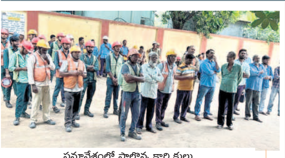
సమావేశంలో పాల్గొన్న కార్మికులు