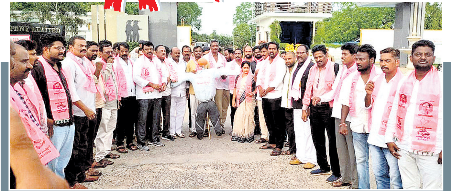
కొత్తగూడెం సింగరేణి : హెడ్కవర్షి ఎదుట దిష్టిబొమ్మ దహనం చేస్తున్న టీజీఎస్ఎం, బీఆర్ఎస్ నాయకులు