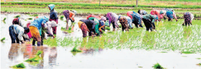
నల్లగొండ జిల్లాలో అరిగిన వర్షాలు వడక ఉపాధి వసూలు లేకపోవడంతో సిద్ధపెట జిల్లాకు వలస వచ్చిన కూలీలు దుంపలపట్టి గ్రామంలో ఇలా వలసవాళ్లు వేస్తున్న కనిపించారు