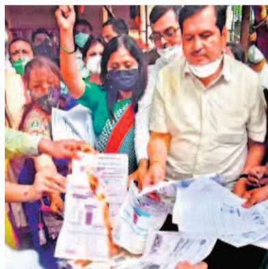
ముంబైలో అదానీ కంపెనీ కరెంటు బిల్లులను మీడియా ఎదుట తగిలబెడుతున్న వినియోగదారులు (ఫైల్)