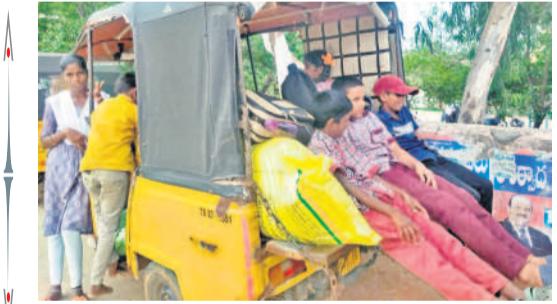
నాగర్ కర్నూల్ నుంచి సాయంత్రం ఆటోలో వెళ్తున్న విద్యార్థులు