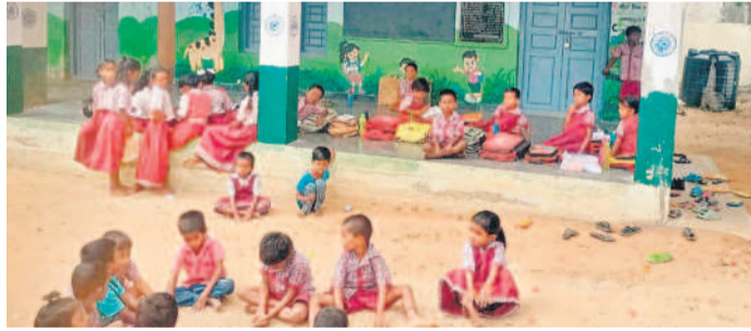
పాఠశాలలో టీచర్లు లేక ఆరుబయట ఆడుకుంటున్న విద్యార్థులు