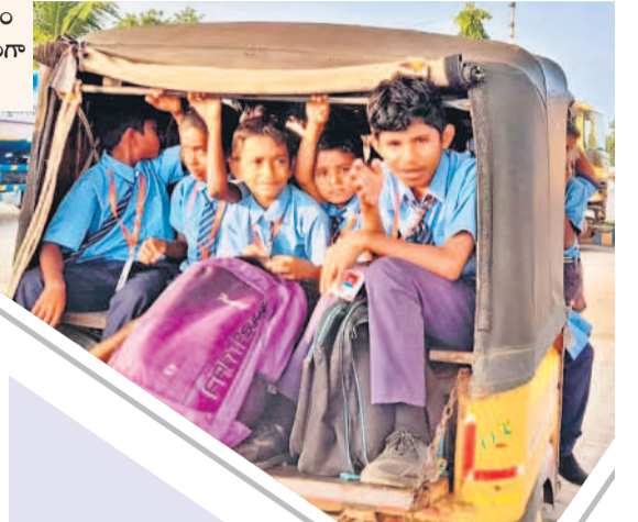
దేవరకల్ల మండలం గడ్డెగూడెం సుంచి పాఠశాలకు ప్రమాదకరంగా ఆటోలో వెళ్తున్న విద్యార్థులు

మూసాపేట, జూలై 3 : మూసాపేట మండలంలోని తుంకిపేట గ్రామం జాతీయ రహదారి నుంచి 3 కిలోమీటర్లు, వేముల గ్రామం కూడా 2 కి.మీ. దూరంలో, గ్రామంలో కేవలం ప్రాథమిక పాఠశాల మాత్రమే ఉన్నది. పైదవులు చదవాలంటే ఇటు మూసాపేట, అటు వేముల గ్రామానికైనా వెళ్లాల్సింది. కానీ బస్సు సౌకర్యం లేకపోవడంతో ప్రతిరోజూ విద్యార్థులు ఉదయం, సాయంత్రం కాలి నడకన వచ్చి వెళ్తుంటారు. అంతదూరం వెళ్లే రావాలంటే ఇబ్బందులు తలెత్తుతుండడంతో పాఠశాల లకు క్రమం తప్పకుండా వెళ్లేలేకపోతున్నామని విద్యార్థులు వాపోతున్నారు. ఎలాగైనా తమ గ్రామం మీదుగా వేములకు బస్సు నడపాలని విద్యార్థులు కోరుతున్నారు. అదేవిధంగా నందిపేట, దాసరిపల్లి, చక్రాపూర్, అచ్యూతపల్లి, తాళ్లగడ్డ, తిమ్మాపూర్, పోల్గుంపల్లి, నిజారాపూర్, మహబూబ్ నగర్ పట్టణం తదితర గ్రామాల విద్యార్థుల పరిస్థితి కూడా అంతే. విద్యార్థులతో పాటు ఆయా గ్రామాల ప్రజలు వివిధ అవసరాల కోసం ప్రయాణం చేయాలి వస్తే ప్రైవేట్ వాహనాలను ఆశ్రయించాలి వస్తున్నది. వాటితో ఎన్నో ప్రమాదాలు జరిగి వికలత్వం రావడంతోపాటు, ఆర్థికంగా కూడా నష్టపోతున్నారు. అందుకని ప్రభుత్వం ప్రతి గ్రామానికీ బస్సు నడిపిస్తే సుందరితర ఆధికారులు ఆలోచించాలి అవసరం ఉన్నది.