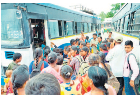
నాగర్ కర్నూల్ బస్స్టాండ్లో బస్సు ఎక్కేందుకు ఎగబడిన విద్యార్థులు

నాగర్ కర్నూల్, జూలై 3 (నమస్తే తెలంగాణ) : చదువుకునేందుకు విద్యార్థులు నానా పాట్లు పడుతున్నారు. ప్రభుత్వం అన్ని వసతులు కల్పిస్తున్నామని చెబుతున్నారానూ సౌకర్యం కల్పించడంలో పూర్తిగా విఫలమవుతున్నది. దీనికి నిదర్శనం ఆటోలు, ట్రాక్టర్ లాంటి వాహనాలను ఆశ్రయిస్తున్న విద్యార్థులే ప్రత్యేక ఉదాహరణగా చెప్పుకోవచ్చు. ప్రభుత్వ పాఠశాలల్లో చదువుకునే విద్యార్థుల రవాణా సౌకర్యం లేక ఇబ్బందులు ఎదురవుతున్నాయి. ప్రభుత్వం వేద విద్యార్థులకు ఉన్నత విద్యను అందిస్తామని ఓ వైపు ప్రకటనలు చేస్తున్నా విద్యార్థులు స్వయంగా సీంపేటలోకి వెళ్లి ఉన్నా అందించిన స్కూలులో చదవులు చేస్తుండడం లేదు. విద్యార్థులు ప్రాథమిక విద్యను పూర్తి చేసి ఉన్న