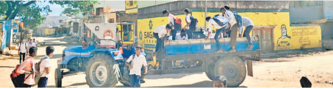
వంగురేనిపల్లి, అచ్యూతపూర్ నుంచి అచ్యూతపల్లి మండల కేంద్రంలోని బడికి ట్రాక్టర్లో వచ్చిన విద్యార్థులు