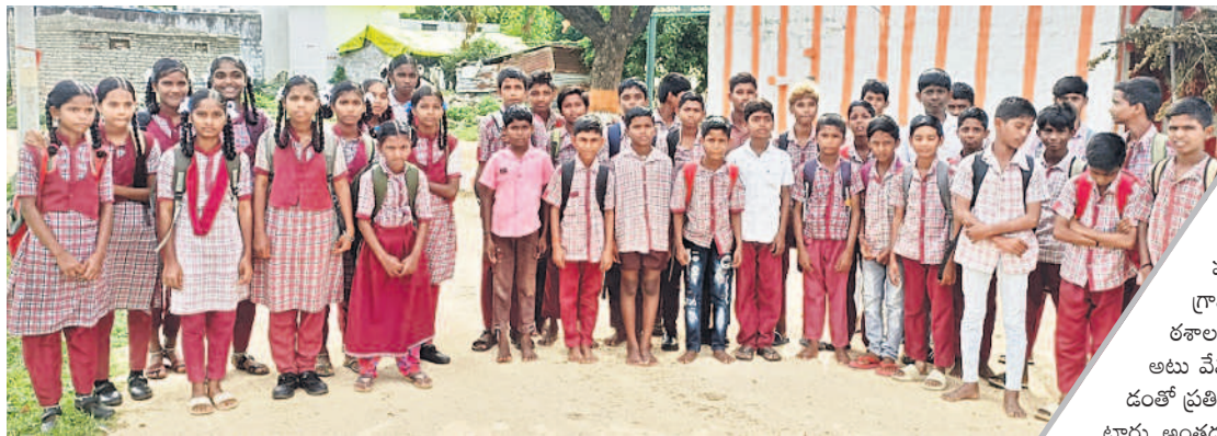
మూసాపేట మండలం తుంకిపేటలో సుంచి వేముల పాఠశాలకు కాలి నడకన వెళ్తున్న విద్యార్థులు

మూసాపేట, జూలై 3 : మూసాపేట మండలంలోని తుంకిపేట గ్రామం జాతీయ రహదారి నుంచి 3 కిలోమీటర్లు, వేముల గ్రామం కూడా 2 కి.మీ. దూరంలో, గ్రామంలో కేవలం ప్రాథమిక పాఠశాల మాత్రమే ఉన్నది. పైదవులు చదవాలంటే ఇటు మూసాపేట, అటు వేముల గ్రామానికైనా వెళ్లాల్సింది. కానీ బస్సు సౌకర్యం లేకపోవడంతో ప్రతిరోజూ విద్యార్థులు ఉదయం, సాయంత్రం కాలి నడకన వచ్చి వెళ్తుంటారు. అంతదూరం వెళ్లే రావాలంటే ఇబ్బందులు తలెత్తుతుండడంతో పాఠశాల లకు క్రమం తప్పకుండా వెళ్లేలేకపోతున్నామని విద్యార్థులు వాపోతున్నారు. ఎలాగైనా తమ గ్రామం మీదుగా వేములకు బస్సు నడపాలని విద్యార్థులు కోరుతున్నారు. అదేవిధంగా నందిపేట, దాసరిపల్లి, చక్రాపూర్, అచ్యూతపల్లి, తాళ్లగడ్డ, తిమ్మాపూర్, పోల్గుంపల్లి, నిజారాపూర్, మహబూబ్ నగర్ పట్టణం తదితర గ్రామాల విద్యార్థుల పరిస్థితి కూడా అంతే. విద్యార్థులతో పాటు ఆయా గ్రామాల ప్రజలు వివిధ అవసరాల కోసం ప్రయాణం చేయాలి వస్తే ప్రైవేట్ వాహనాలను ఆశ్రయించాలి వస్తున్నది. వాటితో ఎన్నో ప్రమాదాలు జరిగి వికలత్వం రావడంతోపాటు, ఆర్థికంగా కూడా నష్టపోతున్నారు. అందుకని ప్రభుత్వం ప్రతి గ్రామానికీ బస్సు నడిపిస్తే సుందరితర ఆధికారులు ఆలోచించాలి అవసరం ఉన్నది.