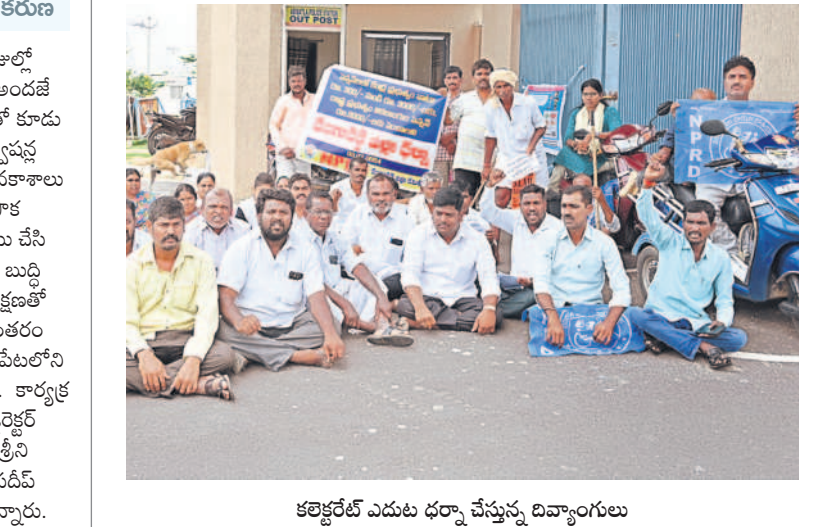
కలెక్టరేట్ ఎదుట ధర్నా చేస్తున్న దివ్యాంగులు