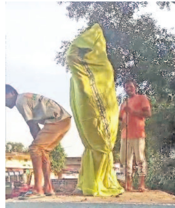
జనగామ జిల్లా దేవరపల్లెల మండలం కామారెడ్డి గూడెంలో తెలంగాణ తల్లి విగ్రహం కూల్చివేతకు యత్నిస్తున్న పంచాయతీ సిబ్బంది

రాజకీయరంగం పులిమి విగ్రహాన్ని కూల్చివేసేందుకు కాంగ్రెస్ యత్నం అనుమతి లేదన్న సాకుతో విగ్రహం తొలగింపునకు అధికారులపై ఎమ్మెల్యే ఒత్తిడి అడ్డుకున్న కామారెడ్డి గూడెం ప్రజలు