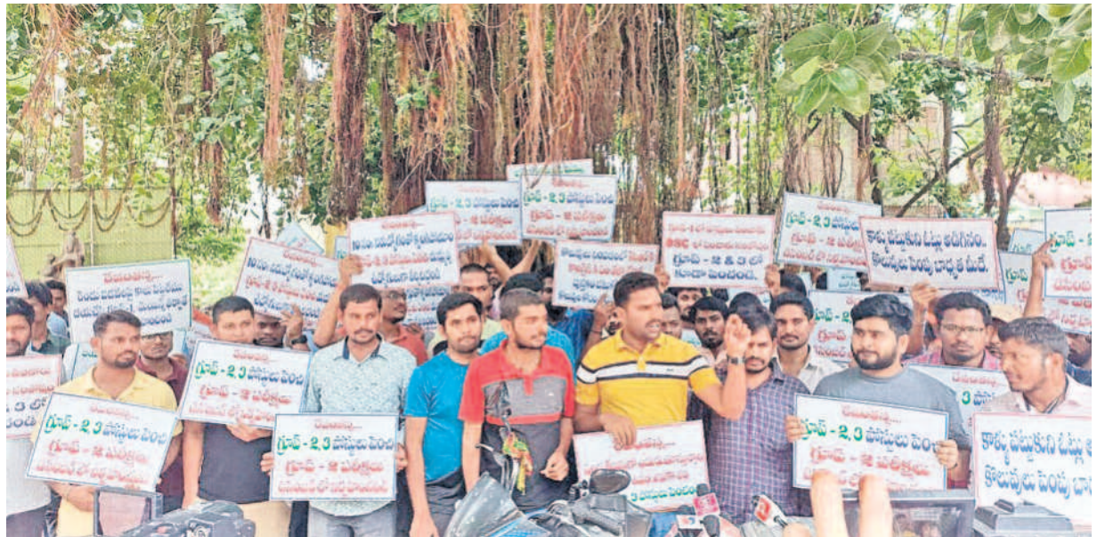
గ్రూప్-2,3 పోస్టులు పెంచాలని డిమాండ్ చేస్తూ గురువారం హైదరాబాద్ నటి సంత్రలేటి వద్ద నిరద్యోగుల నిరసన

జనగామ, జూలై 4 (నమస్తే తెలంగాణ): తెలంగాణలో కేసీఆర్ ఆనవాళ్లు లేకుండా చేస్తానని పదేపదే చెబుతున్న సీఎం రేపంకొండేటి వ్యాఖ్యలను పాలకుర్తి ఎమ్మెల్యే యశస్వినీరెడ్డి నిజం పటి రంగాల్లో బీఆర్ఎస్ చేసిన అభివృద్ధి చేపట్టిన సంక్షేమ కార్యక్రమాలు దేశపరిశ్రలోనే మునుపెన్నడూ లేవని పేర్కొన్నారు. తెలంగాణ వ్యవసాయ ప్రగతిని చూసి మహారాష్ట్ర పంటి పక్క రాష్ట్రాల ప్రజలు తమకూ కేసీఆర్ పాలన కావాలని కోరుకున్నారు గుర్తించారు. 'అటోకి బార్ కిసాన్ సర్కార్' నినాదంతో దేశంలో రైతురాజ్యం తెచ్చుకోవాలని బీఆర్ఎస్ తో కలిసి >2వ పేజీలో