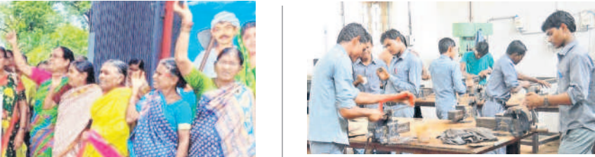
బటిబల్లో రెండో దఫా ప్రవేశాలు