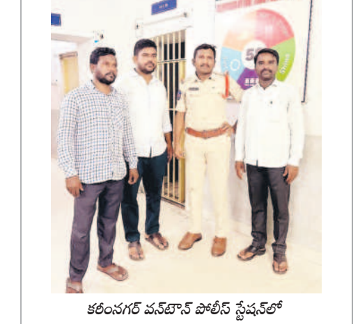
కరీంనగర్ వన్ టౌన్ పోలీస్ స్టేషన్లో విద్యాధి నాయకులు