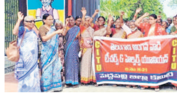
పెద్దపల్లి కలెక్టరేట్ ఎదుట ధర్నా చేస్తున్న అంగన్వాడీ బీబియర్లు