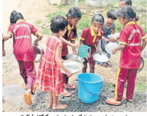
బాలికల స్కూల్లో ప్లేట్లను శుభ్రం చేసుకుంటున్న విద్యార్థులు

పంచాయతీ ఎన్నికలు ఎప్పుడొచ్చినా.. వాటిని సమర్పవంతంగా నిర్వహించేందుకు సిద్ధంగా ఉండాలని రాష్ట్ర ఎన్నికల సంఘం గతేడాది డిసెంబర్లోనే ఆదేశాలు జారీ చేసింది. జీపీ పాలకవర్గాల గడువు ఫిబ్రవరి ఒకటితో పూర్తవుతున్న సందర్భంలో ఎన్నికలను నిర్వహించేందుకు అవసరమైన ఏర్పాట్లు న్నాయి.