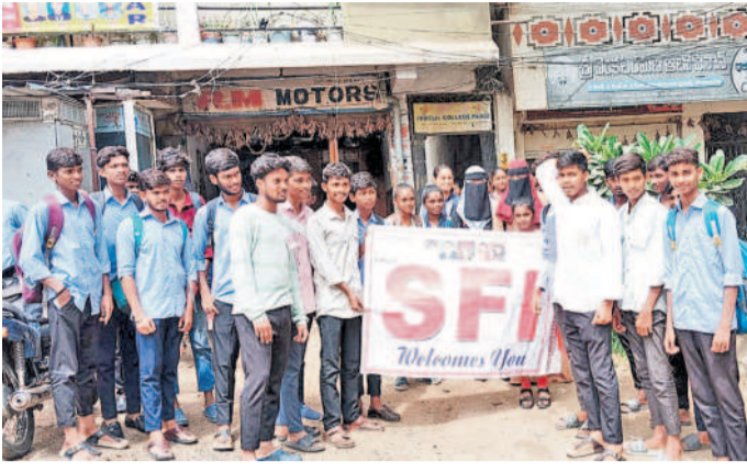
పరిగి: విద్యాసంస్థల బండ్లలో పాల్గొన్న ఎన్ఎఫ్ఐవ్ నాయకులు

తాండూరు, జూలై 4: భారత విద్యాధి పెడచేసిన అధ్యక్షులలో గురువారం తాండూరు నియోజక వర్గంలో నిర్వహించిన విద్యా సంస్థల బండ్ల సంపూర్ణమైంది. తాండూరు పట్టణం, తాండూరు,