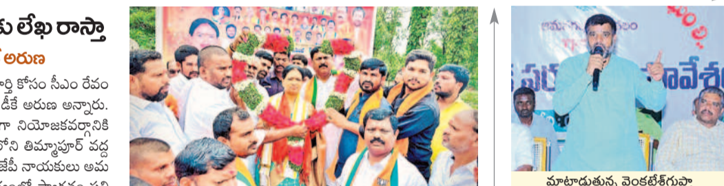
ఎంపీ డీకే అరుణను సన్మానిస్తున్న కొత్తూరు బీజేపీ నాయకులు