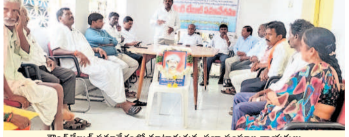
రౌండ్ టేబుల్ సమావేశంలో మాట్లాడుతున్న ప్రజా సంఘాల నాయకులు