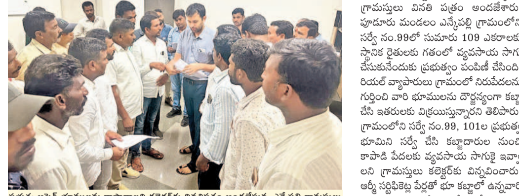
ప్రభుత్వ అసైన్ భూములను కాపాడాలని కలెక్టర్ కు వినివేతం అందజేస్తున్న ఎన్నెప్పల్ గ్రామస్థులు పూడూరు, జూలై 4 : వంద కోట్ల విలువ సర్వేస్ మెన్ (ఆర్టీ) అధికారులు పేదను చేసే ప్రభుత్వ అసైన్ భూములపై ఎన్టీ కొందరు రియల్ ఎస్టేట్ వ్యాపారులు, రాజ