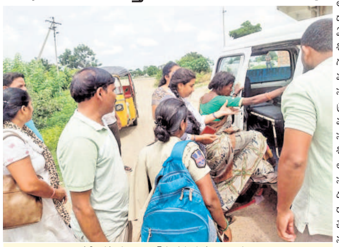
మహిళలకు సఖి సెంటర్ కు తరలింపు అధికారులు