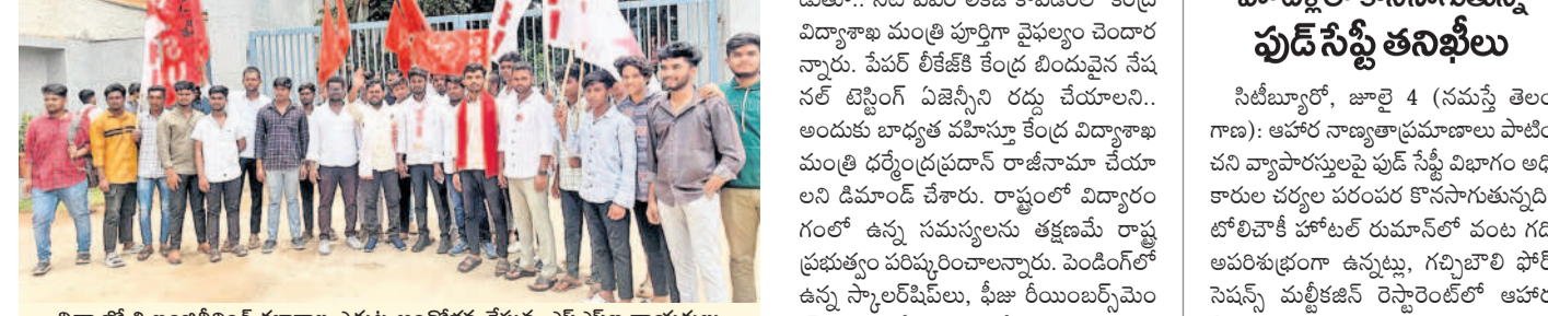
విద్యాశోధిత్ ఇంజనీరింగ్ కళాశాల ఎదుట ఆందోళన చేస్తున్న ఎన్.ఎఫ్.సి నాయకులు