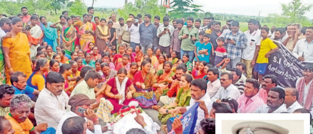
జాతీయ రహదారిపై బైటాయింపిన పెద్ది దంపతులు, ఎస్సె కుటుంబసభ్యులు, దళిత సంఘాల నాయకులు