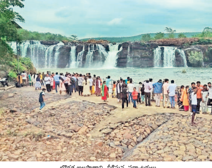
బోగత్ జలపాతాన్ని వీక్షిస్తున్న పర్యాటకులు