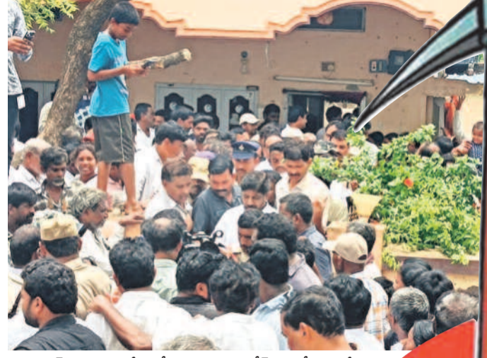
ప్రభాకర్ ఆత్మహత్య కేసులో నిందితుడైన కిశోర్ ఇంట్లో సమావేశం అనంతరం బయటకు వస్తున్న డిప్యూటీ సీఎం భట్టి విక్రమార్య