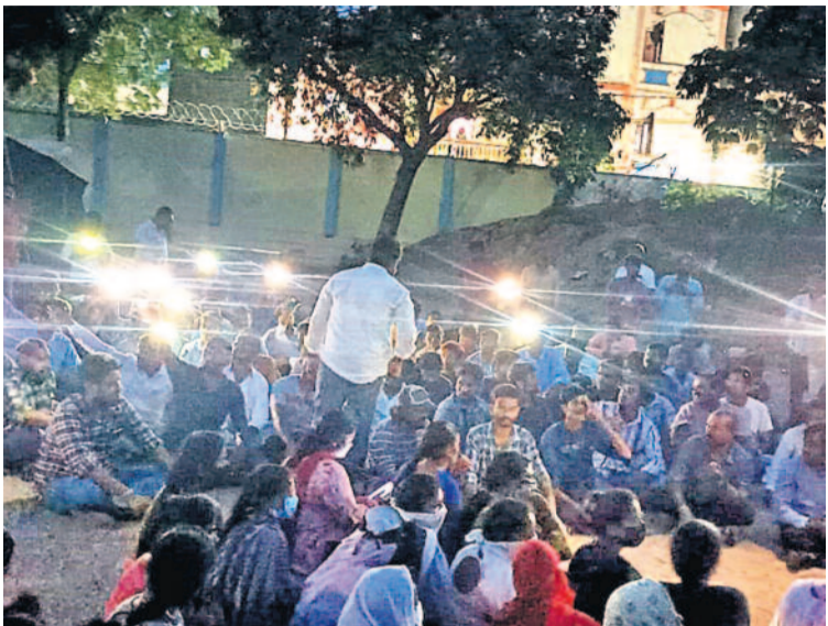
పాఠశాల విద్యార్థులు డైరెక్టరేట్ కార్యాలయ ముట్టడి ఉద్యమం మూలం. నిరసనకు దిగిన సుమారు 500 మందిని అదుపులోకి తీసుకుని సిబ్బంది అడ్డంకు పోలీసులు తరలివారు. అక్కడ లైట్లు కూడా తీసేయడంతో బీకట్లోనే సెల్ ఫోన్ వెలుగులో నిరసన కొనసాగించిన నిరద్యోగులు.. అక్కడి నుంచి ప్రదర్శనగా బయల్దేరి అర్ధరాత్రి అడ్డుకాల్చే వద్ద జైతాయించారు.