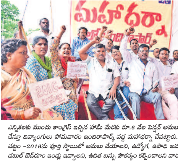
ఎన్నికల ముందు కాంగ్రెస్ ఇచ్చిన హామీ మేరకు రూ.8 వేల పెన్షన్ అమలు చేయాలని డిమాండ్ చేస్తూ దివ్యాంగులు సోమవారం ఇందిరాపార్క్ వద్ద మహాధర్నా చేపట్టారు. దివ్యాంగుల హక్కుల చట్టం -2016ను పూర్తి స్థాయిలో అమలు చేయాలని, ఉద్యోగ, ఉపాధి అవకాశాలు కల్పించాలని, డబుల్ బెడదాం ఇండ్లు ఇవ్వాలని, ఉచిత బస్సు సౌకర్యం కల్పించాలని వారు డిమాండ్ చేశారు. >3