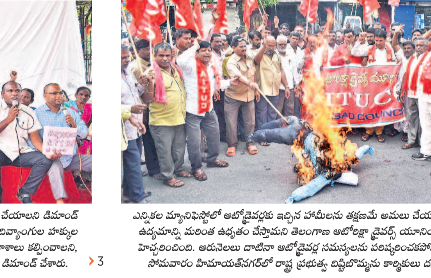
ఎన్నికల మ్యానిఫెస్టోలో ఆటో డ్రైవర్లకు ఇచ్చిన హామీలను తక్షణమే అమలు చేయాలని, లైసెన్స్ లో ఉద్యమాన్ని మరింత ఉద్ధృతం చేస్తామని తెలంగాణ ఆటో డ్రైవర్స్ యూనియన్ ప్రభుత్వాన్ని హెచ్చరించింది. ఆరునెలలు దాటితూ ఆటో డ్రైవర్ల సమస్యలను పరిష్కరించుకోవడాన్ని నిరసిస్తూ సోమవారం హిమాచల్ నగర్ లో రాష్ట్ర ప్రభుత్వ ద్వితీయోత్సవ కార్యక్రమాల దురాసనం చేశారు. >3