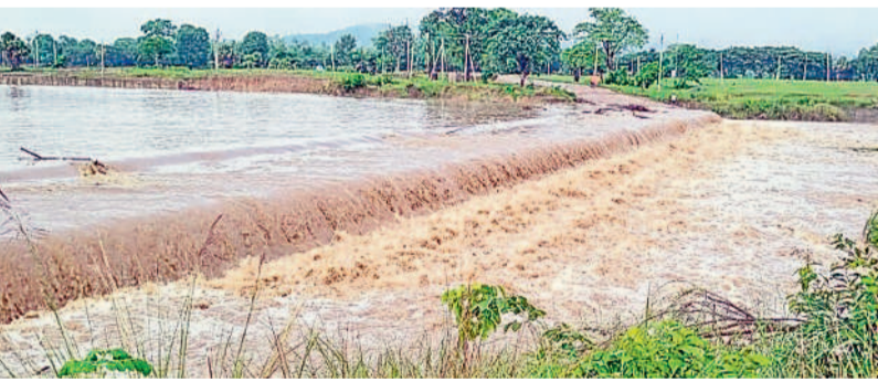
వరద నీటిలో మునిగిన ఎల్లాక లోలేవల్ కాజీవ్

ములుగు, జూలై 8 (నమస్తే తెలంగాణ) : ఇక్కడ నిండా నీటితో కనిపిస్తున్నది వాగు కాదు.. నేషనల్ హైవేనే. సోమవారం తెల్లవారుజామున రెండు గంటల పాటు కురిసిన వర్షానికి ములుగులోని జాతీయ రహదారి జలమయమై వాహనదారులకు చుక్కలు చూపించింది. వరద భారీగా వస్తుండడంతో వాహనాలు ముందుకు వెళ్లేలేక రాకపోకలకు అంతరాయం కలిగింది. బస్సు, లారీ, కార్లు ఎలాగోలా వెళ్తున్నాయి. ద్వితీయ వాహనదారులు వరద దాటలేని పరిస్థితి ఉంది. అయితే ప్రతి వర్షాకాలం ఈ సమస్య ఎదురవుతున్నా ఎన్ఐఎన్ అధికారులు మాత్రం శాశ్వత పరిష్కారం చూపడం లేదు. చివరకు ములుగు గ్రామ పంచాయతీ సిబ్బంది జేసీబీ సహాయంతో డిప్లొమెట్ తోలగించి వరద నీటిని తరలించే పనులను చేపడుతున్నారు. ఎన్ఐఎన్ విస్తరణ పనులు చేపట్టక ముందు