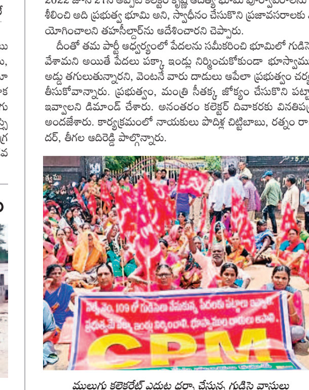
ములుగు కలెక్టరేట్ ఎదుట ధర్మా చేస్తున్న గుడిసె వాసులు