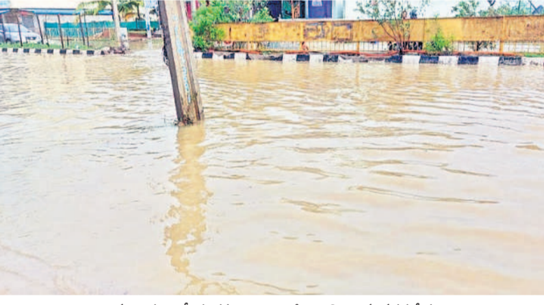
ములుగు జాతీయ రహదారిపై భారీగా నిలిచి ఉన్న వరద నీరు

మద్యం వినియోగం పెరుగుతుండడంతో సమాజంలోని చాలా అంశాలపై ప్రతికూల ప్రభావం పడుతున్నది. పేద ఆర్థిక పుష్టత, ఆరోగ్యం దెబ్బతినడంతో పాటు శాంతిభద్రతల విషయంలో ఎక్కువగా సమస్యలు వస్తున్నాయి. ప్రభుత్వం అనుమతి ఇచ్చిన షాపులకు తోడుగా బెల్ట్ షాపులు ఉండడంతో ఎక్కడపడితే అక్కడ, ఎప్పుడు పడితే అప్పుడు మద్యం అందుబాటులో ఉంటున్నది. అర్ధరాత్రి కూడా యెట్టిగా మద్యం అమ్మకాలు జోరుగా సాగుతున్నాయి. మద్యం వినియోగం పెరగడం వల్ల మద్యం, కుటుంబ పంచాయతీలు పెరుగుతున్నాయి. మహిళలు, పిల్లలపై అపరాధాలు లకు ప్రధానంగా మద్యమే కారణమవుతున్నది.