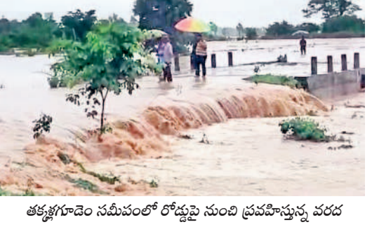
తక్కళ్ గూడెం నడుమంలో రోడ్డుపై నుంచి ప్రవహిస్తున్న వరద

రోడ్డు పైకి వరద, నిలిచిన రాకపోకలు మంగవేల, జూలై 8 : మంగవేల మండలంలోని కొత్తూరు మొట్టగూడెం, తిమ్మాపురం, రోమ్మ, తక్కళ్ గూడెం తదితర గ్రామాల్లో సోమవారం భారీ వర్షం కురిసింది. దీంతో కమ్మవారు, ముసలమ్మవారు, గౌరారం, కమ్మలూరుం ఎర్రవారిల్లో వరద పెరిగింది. తక్కళ్ గూడెం వద్ద వరద ప్రవాహం రోడ్డుపై కొచ్చింది. కొత్తూరు మొట్టగూడెం-బొమ్మాయి గూడెం నడుమ గౌరారం వారు రోడ్డుపై నుంచి ఉధృతంగా ప్రవహించడంతో రోజంతా రాకపోకలు నిలిచిపోయాయి. వరద పెరగడంతో గ్రామస్థులు అప్రమత్తంగా ఉండాలని, ఏదైనా అత్యవసరం ఉంటే అధికారుల సహాయం పొందాలని పంచాయతీ సిబ్బంది గ్రామస్థులకు సూచనలు చేశారు.