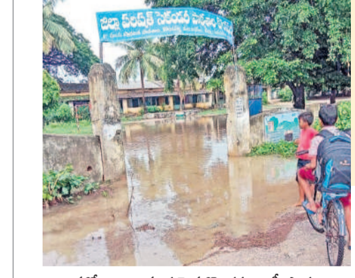
బస్చోలు : జలమయమైన కొండపల్లి జడ్చీ పాఠశాల

బస్చోలు, జూలై 8 : మండలంలోని కొండపల్లి గ్రామంలోని జడ్చీ పాఠశాల రాత్రి కురిసిన వర్షాల వల్ల నీరు అడుగుతుంది. గతంలో పాఠశాల కాంపౌండ్ వాల్ అనుకొని సైడ్ డ్రైనేజీ ఉండేది. పాఠశాల ముందు నుంచి సైడ్ డ్రైనేజీ ద్వారా అండర్ డ్రైనేజీ లింక్తో రోడ్డుకు అను వైపు వద్ద నీళ్లు పోయేవి. కానీ అండర్ డ్రైనేజీ పైపులు చాలా సమయం త్వరాల క్రితం వేసినవి కావడం.. ఆ పైపులు మీదుగా భారీ గ్రానైట్ లారీలు నిత్యం వెళ్లడం వల్ల అండర్ లింక్ వెళ్లే పరిస్థితి నెలకొంది. పాఠశాలకు వచ్చిన చిన్న పిల్లలు తిరిగి ఇంటికి వెళ్లడంతో విషయం తెలుసుకున్న పాఠశాల అధికారులు పాఠశాల వద్దకు వెళ్లి దింపి వచ్చారు. స్థానిక ఎమ్మెల్యే వెంటనే స్పందించి కొండపల్లి పాఠశాలకు వచ్చిన సైడ్ డ్రైనేజీ, నీళ్లు రోడ్డు దాటి పోవడానికి అండర్ డ్రైనేజీ, ఈర్డు గుడి నుంచి పీల్ వరకు శాశ్వతమైన సైడ్ డ్రైనేజీ నిర్మాణాలని విద్యార్థుల తల్లిదండ్రులు, గ్రామస్థులు కోరుతున్నారు.