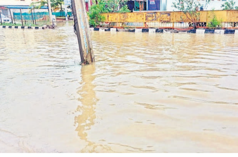
ములుగు జాతీయ రహదారిపై భారీగా నీలిచి ఉన్న వరద నీరు