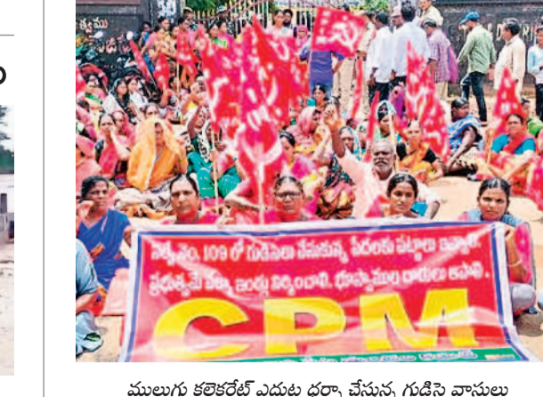
ములుగు కలెక్టరేట్ ఎదుట ధర్మా చేస్తున్న గుడిసె వాసులు

పట్టాలిచ్చి ఇండ్లు నిర్మించాలి ములుగు కలెక్టరేట్ ఎదుట గుడిసెల వాసుల ధర్మా ములుగు రూరల్, జూలై 8 : తాము వేసుకున్న గుడిసెలకు పట్టాలు ఇచ్చి ఇండ్లు నిర్మించాలని, భూస్వాముల దాడులను ఆపాలని డిమాండ్ చేస్తూ ములుగు కలెక్టరేట్ ఎదుట గుడిసెవాసులు సోమవారం సీపీఎం ఆధ్వర్యంలో ధర్మా చేశారు. ఈ సందర్భంగా సీపీఎం జిల్లా కార్యదర్శి కుమార్ల వెంకటేశ్వర్లు మాట్లాడుతూ గోవిందాపురం మండలం పట్టా నాగార్లం రెవెన్యూ శివారు సర్వే నంబర్ 109/క/1లోని పదికరాల్లో రెండేళ్ల క్రితం పేదలు గుడిసెలు వేసుకున్నారని తెలిపారు. ఈ ప్రభుత్వ భూమిని ఆక్రమించుకోవడం కోసం 60 ఏళ్లగా వద్దరు భూస్వాములు కోర్టుల చుట్టూ తిరుగుతున్నారని అన్నారు. 2022 జూన్ 27న అప్పటి కలెక్టర్ కృష్ణ ఆదిత్య భూమి పూర్వాయాలను పరిశీలించి అది ప్రభుత్వ భూమి అని, స్వాధీనం చేసుకొని ప్రజావసరాలకు వినియోగించాలని తహసీల్దార్ ను ఆదేశించారని చెప్పారు. దీంతో తమ పార్టీ ఆధ్వర్యంలో పేదలను సమీకరించి భూమిలో గుడిసెలు వేశామని అయితే పేదలు పక్కా ఇండ్లు నిర్మించుకోకుండా భూస్వాములు అడ్డు తగులుతున్నారని, వెంటనే వారు దాడులు ఆపాలా ప్రభుత్వం చర్యలు తీసుకోవాలన్నారు. ప్రభుత్వం, మంత్రి సీతక్క జోక్యం చేసుకొని పట్టాలు ఇవ్వాలని డిమాండ్ చేశారు. అనంతరం కలెక్టర్ దివాలకరకు వినతిపత్రం అందజేశారు. కార్యక్రమంలో నాయకులు పాడిశ్రీ దిట్టిబాబు, రత్నం రాజేందర్, తీగల ఆదిరెడ్డి పాల్గొన్నారు.