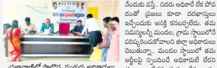
ప్రజావాణిలో పాల్గొన్న ముగ్గురు అధికారులు

పెద్దపూర్ : జిల్లా కలెక్టర్ ప్రతిష్టాత్మకంగా ప్రతి సోమవారం మండల కేంద్రాల్లో చేపట్టిన ప్రజావాణి కార్యక్రమానికి అన్ని కాలాల్లో అధికారులు హాజరు కావాలి, ఉన్న సగం మంది కూడా రాక పోవడంతో ప్రజల్లో అసక్తి తగ్గినట్లు తున్నది. సోమవారం పెద్దపూర్ మండల కేంద్రంలో జరిగిన ప్రజావాణిలో ఉదయం కార్యక్రమం మొదలు కాగానే 13 మంది అధికారులు దీర్ఘ రిజైన్ లో సలహాలు చేసి వెళ్లారు. కేవలం ఇన్చార్జి ఎంపీటీడీ, గ్రామ