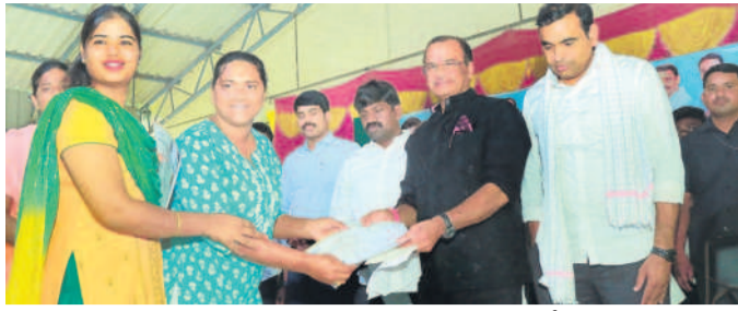
ట్రాన్స్ జెండర్లకు ప్రవచనాలు అందిస్తున్న మంత్రి కోమటిరెడ్డి