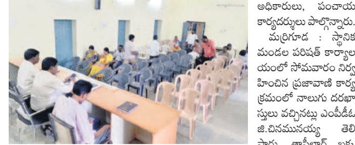
ఉదయం 10.40 గంటలకు నల్లగొండలో ప్రజావాణి వర్తమాని